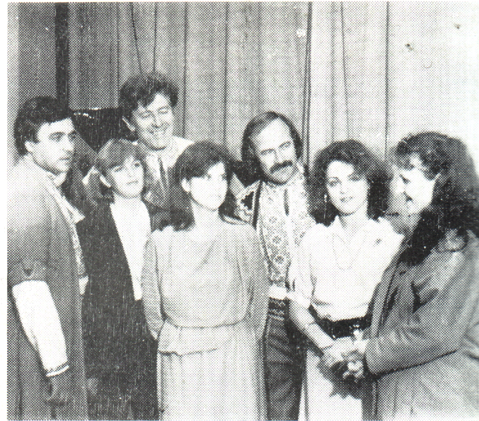
Зустріч учасників хорovої капели з кvартетом «Явір».

Розуміння місцевої пісні, манера її виконання, мудрість в підборі репертуару — ось що притаманне цьому колективу. Керівник виробив досвід освоєння манери народного колективного співу і вже потім прийшов до висновку, що така манера — це комплекс вокально-інструментальних засобів, прийомів, які народжуються під впливом традицій даного регіону. Тому дуже важливо, щоб учасники колективу оволодівали єдиними особливостями розмовного і музичного діалектів, виконавської манери, яка передається з покоління в покоління. І тому вокально-хореографічні композиції будуються на матеріалах місцевих пісень. Звучання хору відмічається багатством тембрів і своєрідністю голосів. Любов до пісні зараз об'єднує 35 аматорів. Його прикрасою