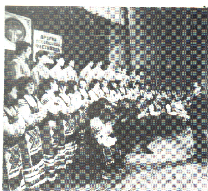
Виступає народний самодіяльний хор «Розмай».

В 1982 році на базі факультету підготовки вчителів початкових класів створений ще один колектив художньої самодіяльності — студентський хор «Розмай», незмінним ке-