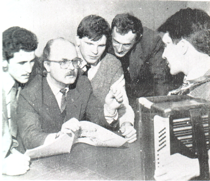
Народжується нова пісня.

В основі репертуару — самобутні, неповторні твори. Це пісні, записані на Волині поетесою Лесею Українкою, волинськими композиторами М. Стефанишиним, В. Герасимчуком, а також керівником колективу. Чудовий край Волині — поетичний, самобутній, багатий на танці, пісні, музику. І існує тут дві манери хорového співу — академічна і народна. Л. Українка писала, «що в селі Колодяжному діти, так як і дорослі, намагаються співати якомога більше грубшими голосами, на цілу октаву нижче...», [Л. Українка, т. 9, ст. 101]. Тому і в хорovому колективі «Розмай», у жіночих хорovих партіях застосовується дві манери співу.