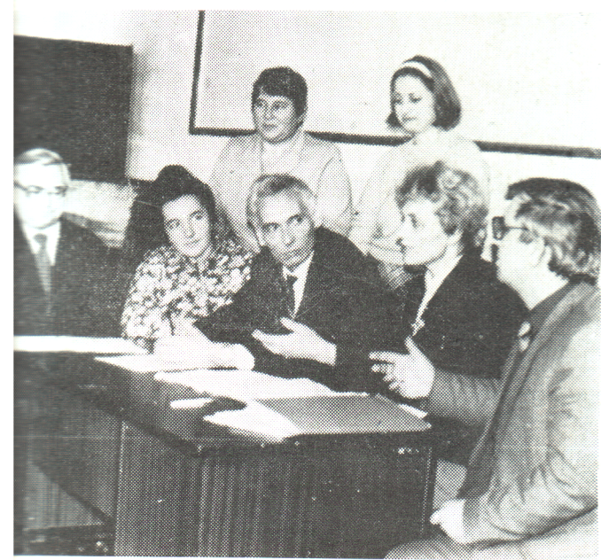
Йде засідання художньої ради капели.

вож парткому, профкому, комітету комсомолу. На засіданні ради затверджуються програми концертів, репертуарні плани.