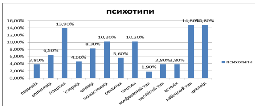
Рис. 2.1. Відсоткове співвідношення психотипів особистості

Ілюстрації потрібно нумерувати арабськими цифрами порядковою нумерацією в межах розділу, за винятком ілюстрацій, наведених у додатках. Номер ілюстрації складається з номера розділу та порядкового номера ілюстрації, відокремлених крапкою, наприклад, другий рисунок третього розділу позначається як «Рисунок 3.2» або «Рис. 3.2». Посилання на ілюстрації роботи вказують порядковим номером ілюстрації, наприклад, «Рис. 1.2».