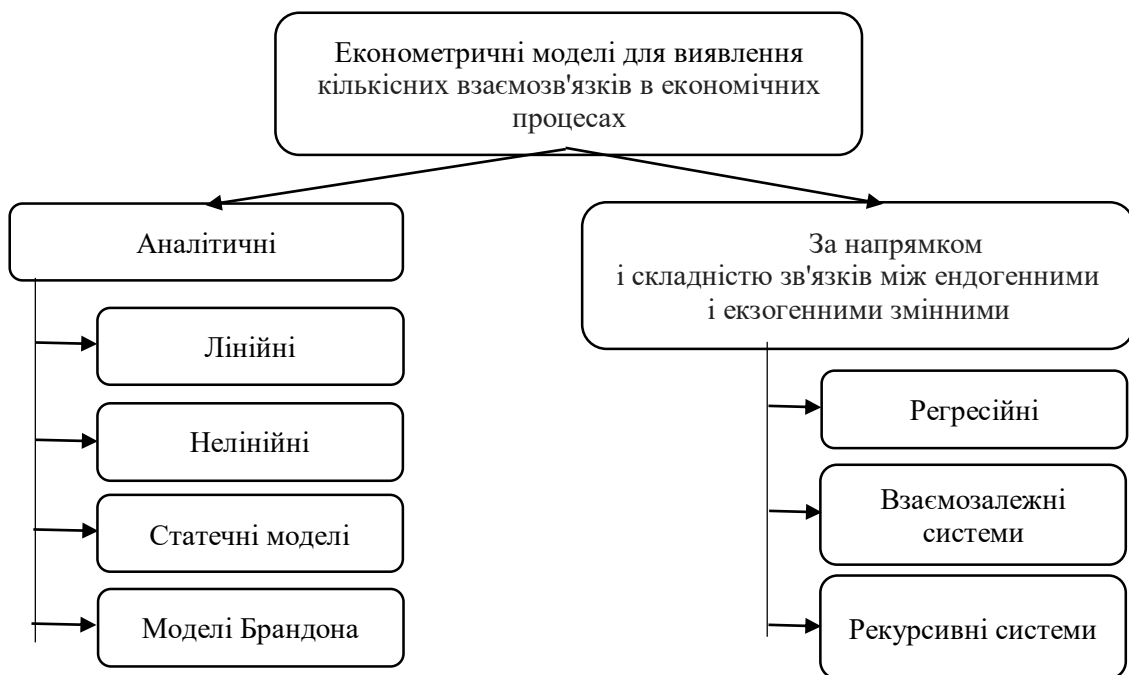
Рис. 1. Схема класифікації економетричних моделей, які використовуються для виявлення кількісних взаємозв'язків в економічних процесах

Застосування економетричних моделей в системі прийняття рішень менеджментом підприємства стосовно вирішення стратегічних або поточних питань функціонування суб'єкта господарювання чи планування його діяльності в майбутніх періодах передбачає, перш за все, ознайомлення персоналу, аналітиків компаній, а також менеджерів, котрі відповідальні за прийняття рішень щодо впровадження одержаних за рахунок застосування економіко-математичних моделей результатів у практику діяльності компанії, із самою специфікою економетричних моделей, їх можливостей та факторів, котрі впливають на прийняття рішень. Виходячи з цього, виникає необхідність адаптації наявного економетричного інструментарію до вимог та потреб менеджерів підприємств, відповідальних за прийняття рішень щодо прогнозування значень ендогенних змінних або регресантів. Проте, як показує практика, сам процес дослідження зв'язків між критеріальними показниками та факторами, які на них впливають може бути ефективно реалізований лише за умови використання адекватних моделей економетричного аналізу. Відтак, існує потреба виділення комплексу моделей, які можуть реально забезпечити потребу підприємств в якісному прогнозуванні економічних процесів на основі фактичних даних (рис. 1).