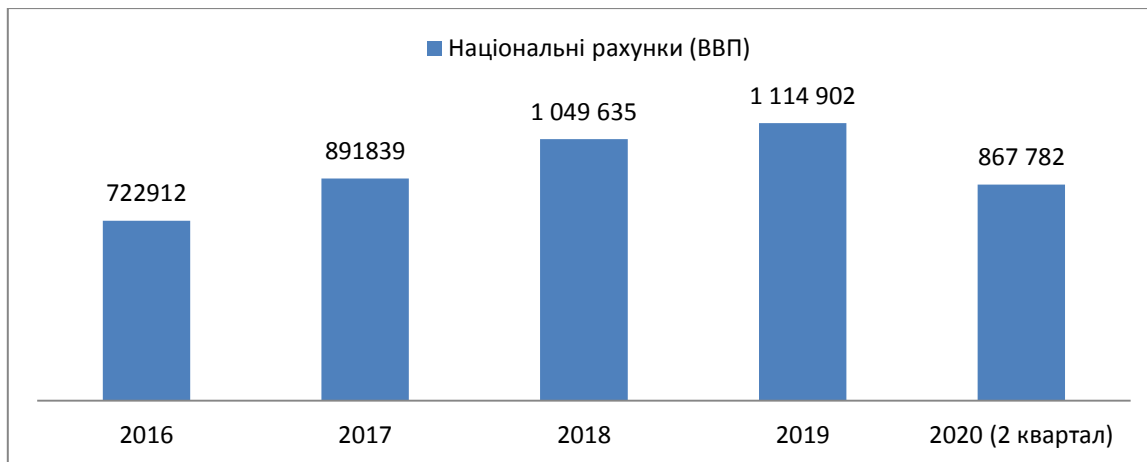
Рис. 1. Валовий внутрішній продукт (у поточних цінах, млн грн) 2016–2020 [3]

слід на рівні безробіття. Адже кількість безробітних значно зростає. Зараз найрозвинутішими та перспективними галузями є агропромисловість та металургія. Це ті галузі, які не дивлячись на погіршення ситуації, мають позитивну динаміку та не зменшують обсяги експорту.