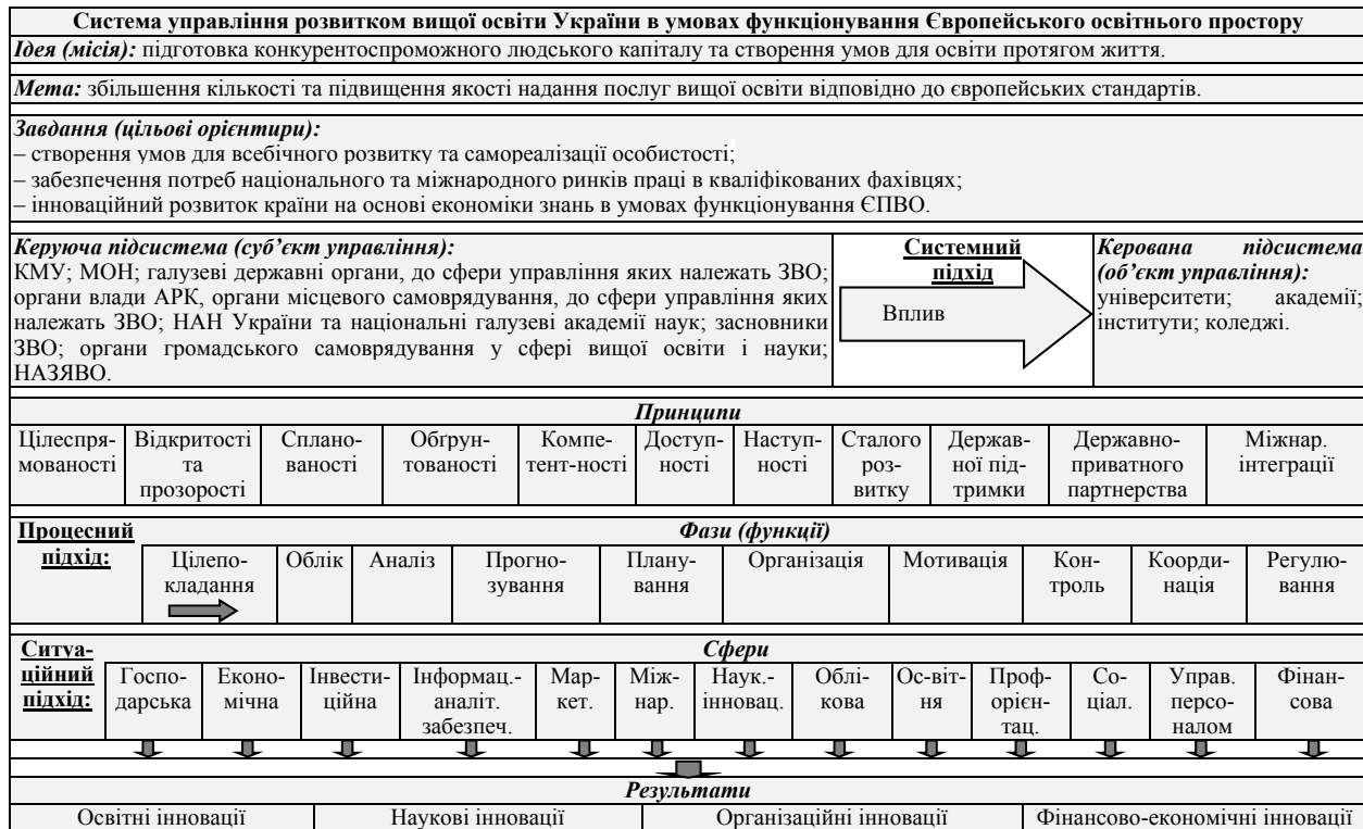
Рис. 2.1. Система управління розвитком вищої освіти України в умовах функціонування ЄПВО