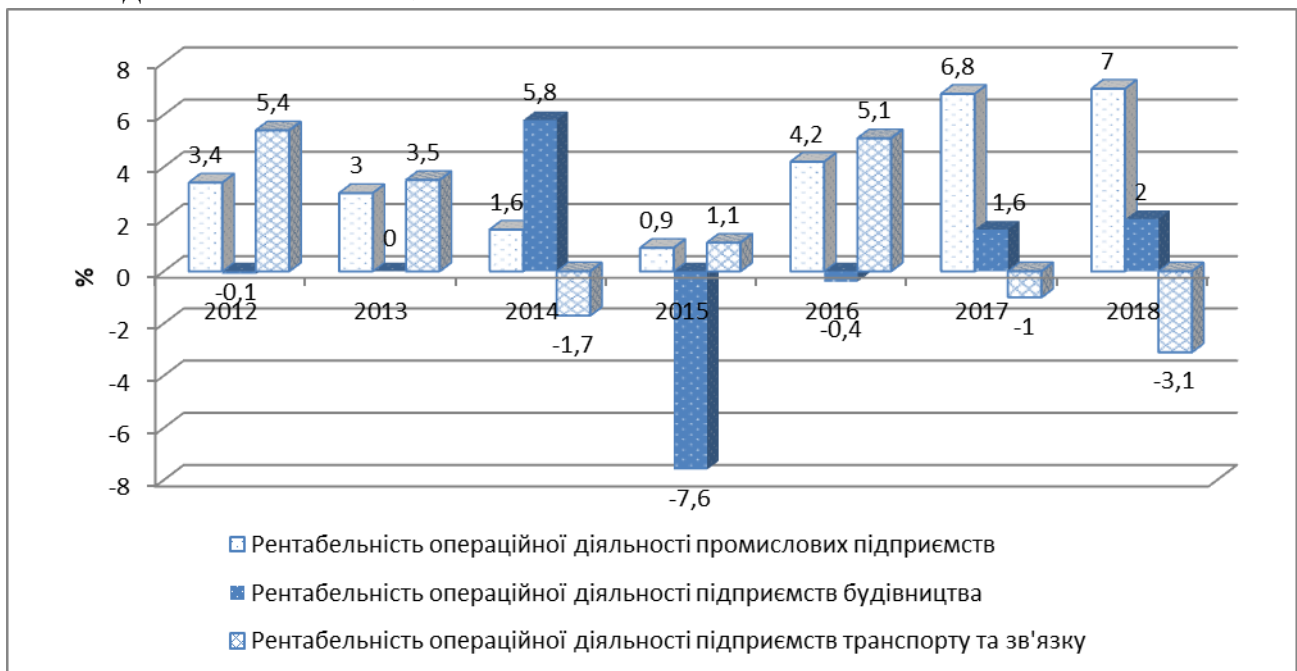
Рис. 2. Динаміка рентабельності операційної діяльності підприємств в Україні за видами економічної діяльності у 2012-2017 роках Джерело: складено за даними Державної служби статистики.

Нестійка динаміка рентабельності операційної діяльності промислових підприємств (рис. 2) все ж за останні роки наблизилася до оптимальних рекомендованих меж 6-10%.