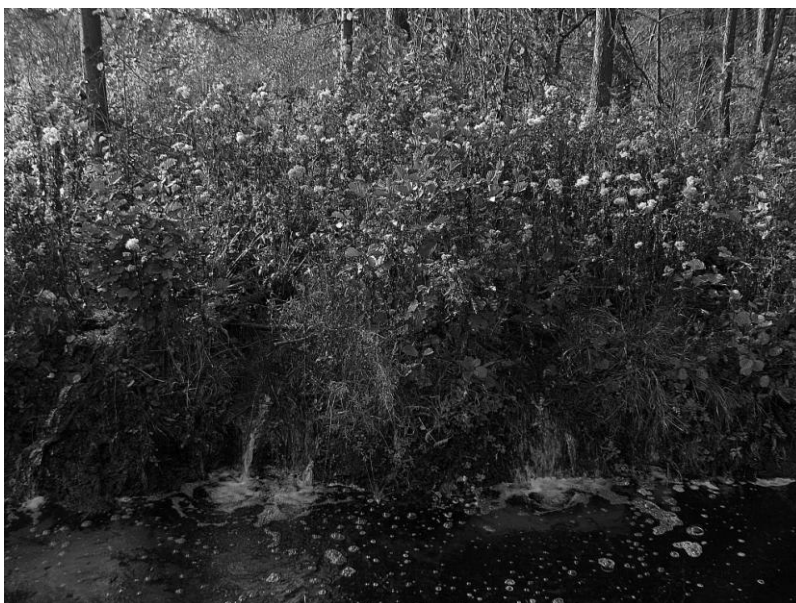
Рис. 2. Природні джерела – «обрічки» – у проєктованому заказнику

В другому ярусі поширені Corylus avellana L., Frangula alnus Mill., Sambucus nigra L. та S. racemosa L., Rubus idaeus L., зрідка трапляються Daphne mezereum L., Euonymus verrucosa Scop., Juniperus communis L., Rubus nessensis W.Hall., Sorbus aucuparia L. У цьому ярусі також виявлено Salix aurita L., S. caprea L., поодинокі трапляються Padus avium Mill., Rhamnus cathartica L. У чагарниковому ярусі зрідка трапляється Sarothamnus scoparius (L.) Koch – неморальний європейський вид лучно-чагарникових угруповань, що потребує охорони.