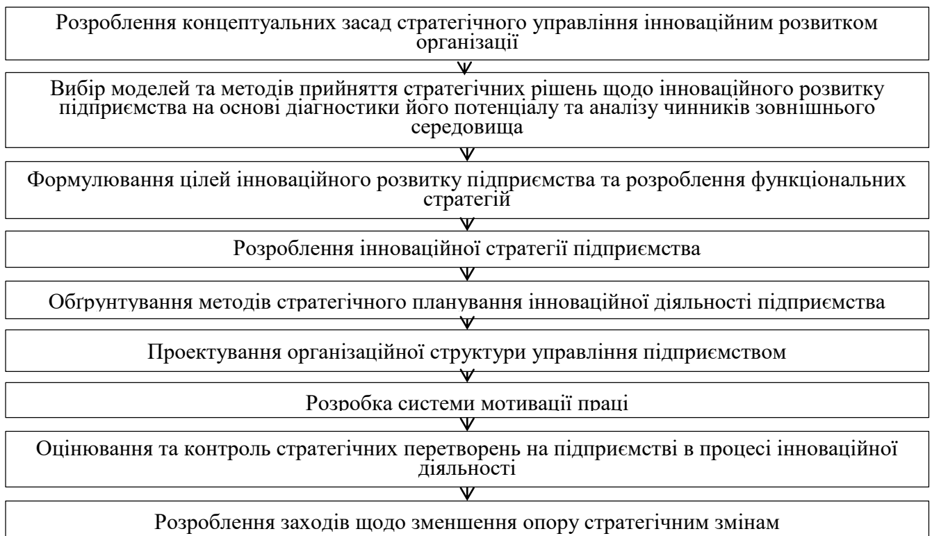
Рис. 2. Схема концептуального підходу до стратегічного управління інноваційним розвитком підприємства [3].

Стратегічне управління інноваційним розвитком передбачає передусім визначення місця і ролі інновацій у реалізації загальної стратегії організації, яку розробляють для досягнення перспективних цілей в умовах конкурентного середовища. Розглянемо загальну послідовність формування підходу до управління інноваційним розвитком підприємства на засадах стратегічного менеджменту (рис. 2).