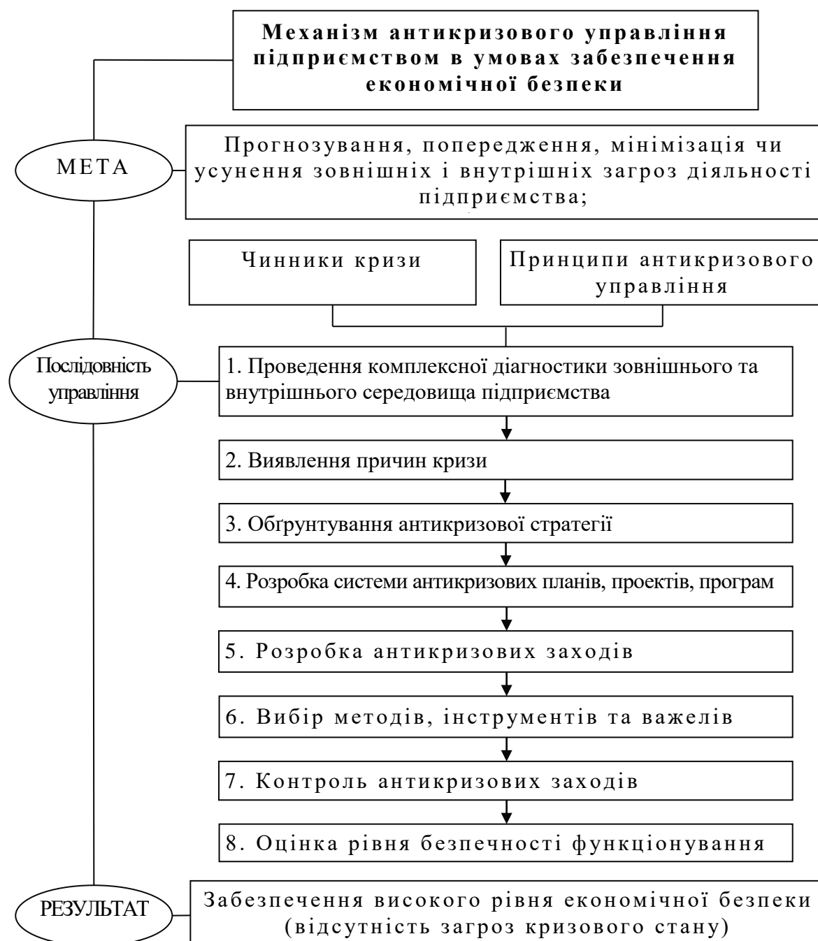
Рис. 2. Механізм антикризового управління в умовах забезпечення економічної безпеки підприємства