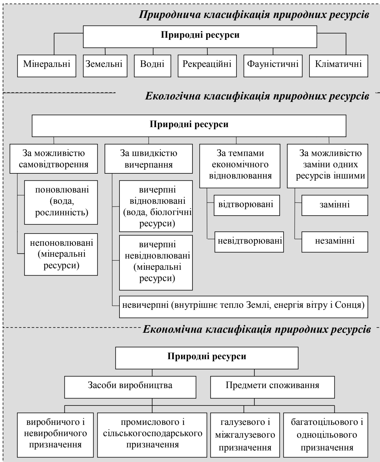
Рис. 5.1. Класифікація природних ресурсів

фактори життєзабезпечення існуючого тваринного та рослинного світу.