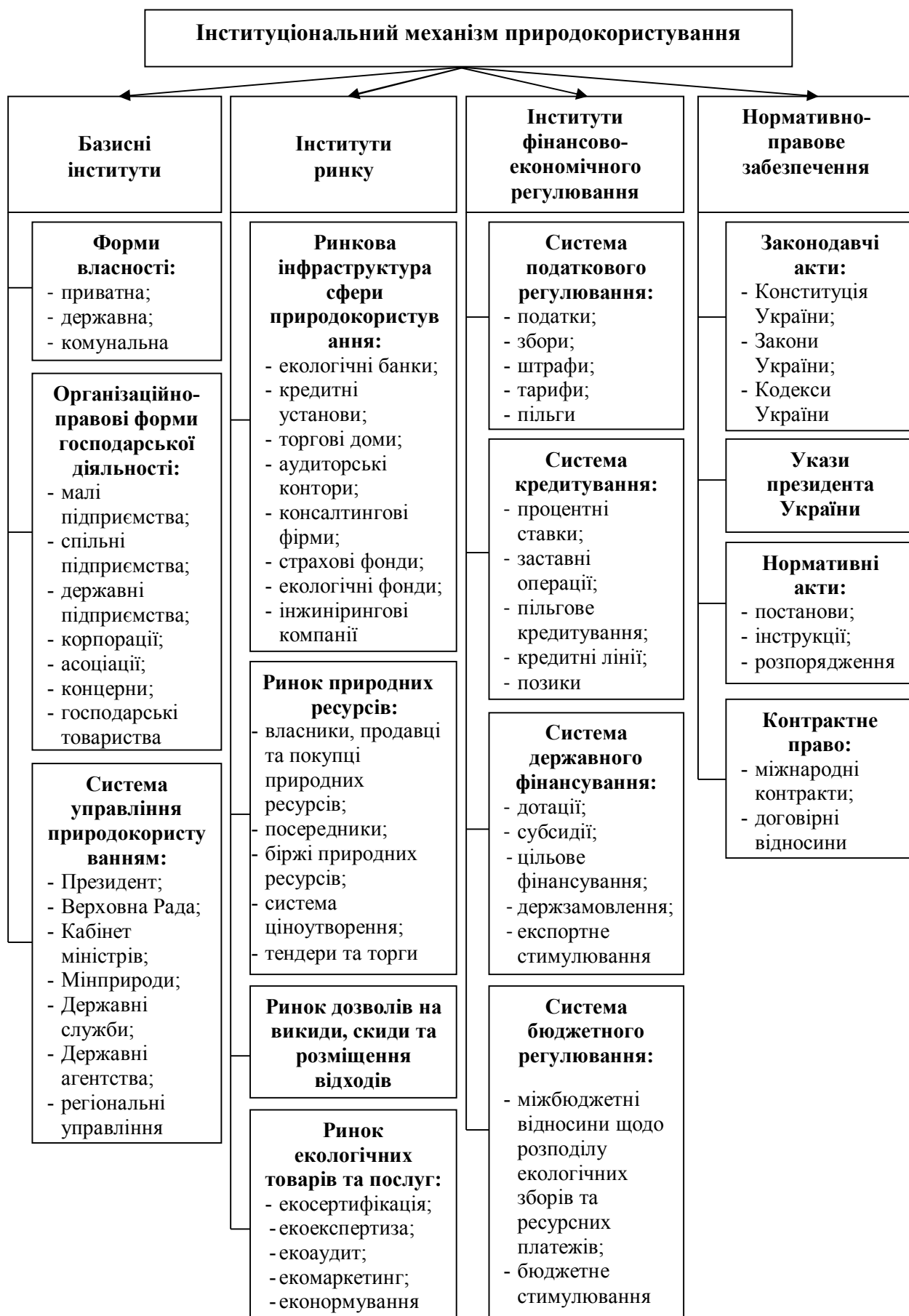
Рис. 7.1. Схема інституціонального механізму