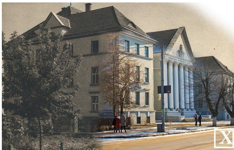
Рис. 3. Краєзнавчий музей, м. Луцьк, 2000-ті рр. (вул. Шопена, 20)

У 1930 р. завершили споруджувати будівлю для Окружного земельного управління у стилі неокласицизму за проектом архітектора К. Яницького. Ця споруда стала ще однією прикрасою тогочасного Луцька (рис. 3).