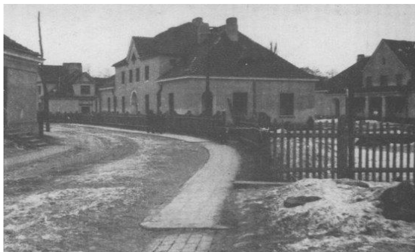
Рис. 4. Будівля міської адміністрації в м. Луцьк (вул. На Таборищі, 3)