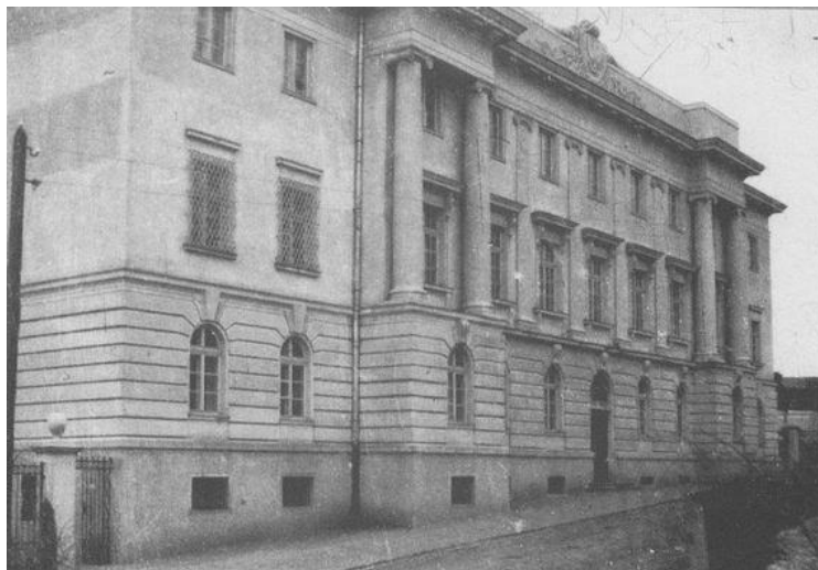
Рис. 2. Філія Національного банку України, м. Луцьк 1980-ті рр. (вул. Градний узвіз, 4)

Наступним об'єктом екскурсії є приміщення Польського банку (вул. Градний узвіз, 4). Історія вулиці бере свій початок із XIX ст. Тоді тут була Градна гора з цвинтарем. Звідси, до речі, й сучасна назва узвозу. З часом дорога, яка проходила вздовж цвинтаря, утворила вулицю. Тоді там і почали з'являтися житлові будинки. На початку XX ст. Градну гору зрівняли. У 1926 р. тут звели розкішний триповерховий будинок Польського банку. З часом його функціональне призначення не змінилося. Нині тут розміщена регіональна філія Національного банку України (рис. 2).