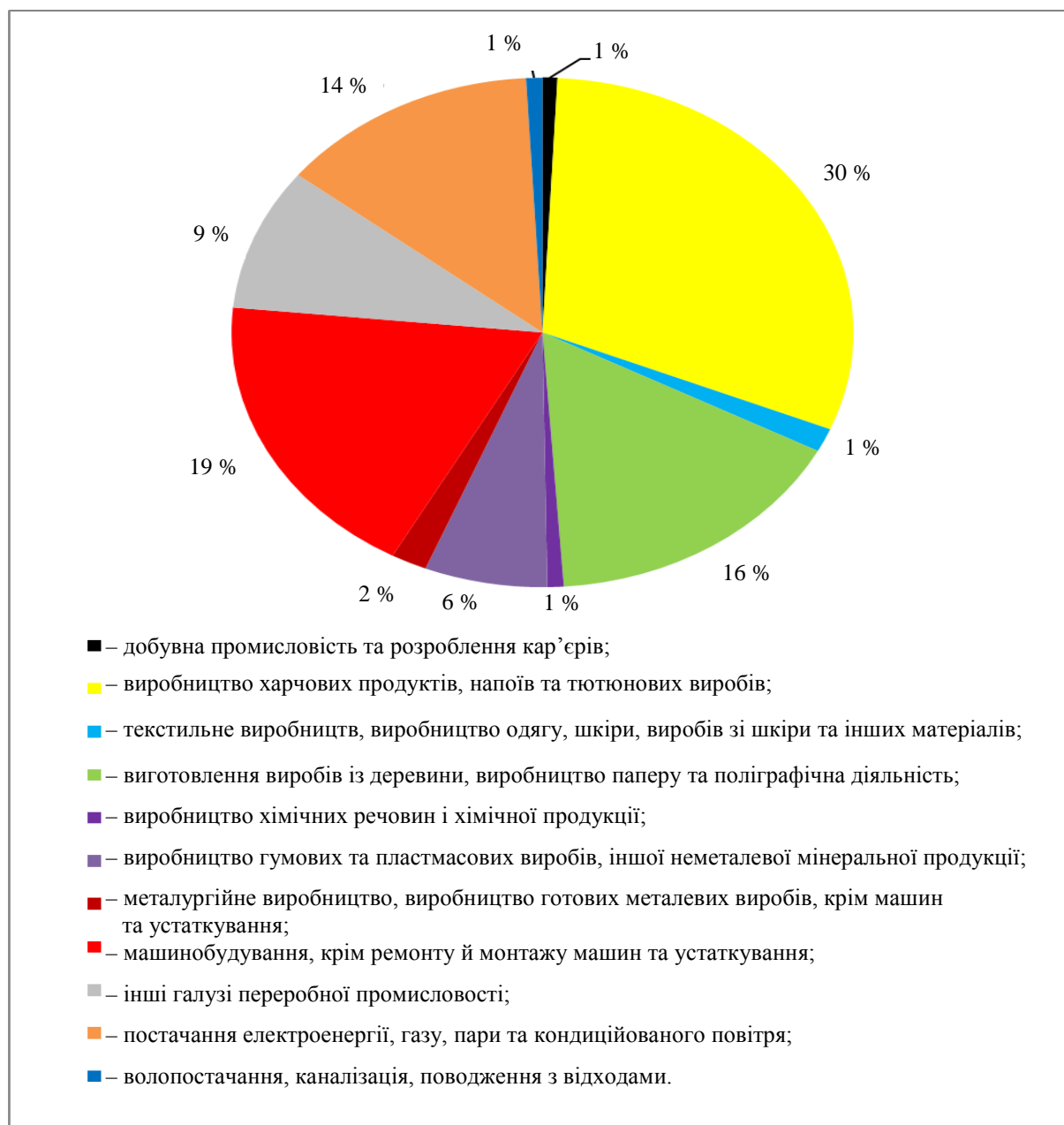
Рис. 2. Галузева структура промисловості Волинської області (2015 р.)

У промисловому комплексі Волинської області простежуємо низку проблем, які заважають його ефективному функціонуванню та розвитку. Це, насамперед, глибокі кризові явища й процеси, які розпочалися ще на початку 90-х рр. XX ст. Відбулося різке падіння обсягів випуску промислової продукції. Як уже зазначено вище, Волинська область з індустріально-аграрної стала аграрно-індустріальною.