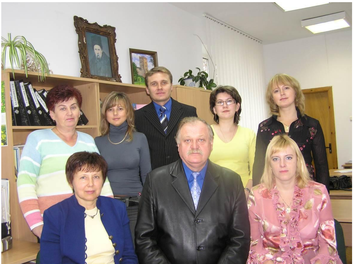
Із членами кафедри української мови (листопад 2007 р.)