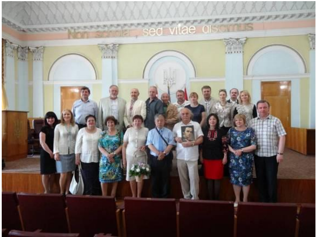
Із учасниками конференції, присвяченої 200-річчю від дня народження Тараса Шевченка (травень 2014 р.)