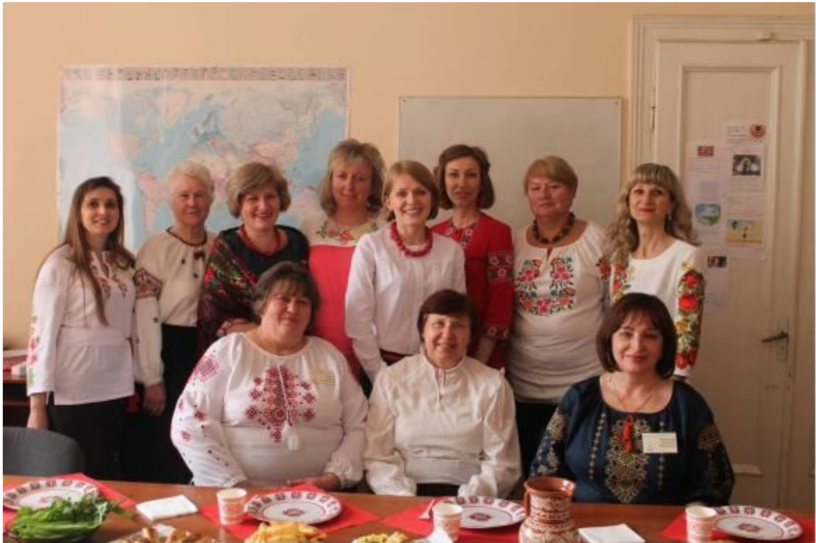
Із членами кафедри романських мов та інтерлінгвістики (квітень 2015 р.)