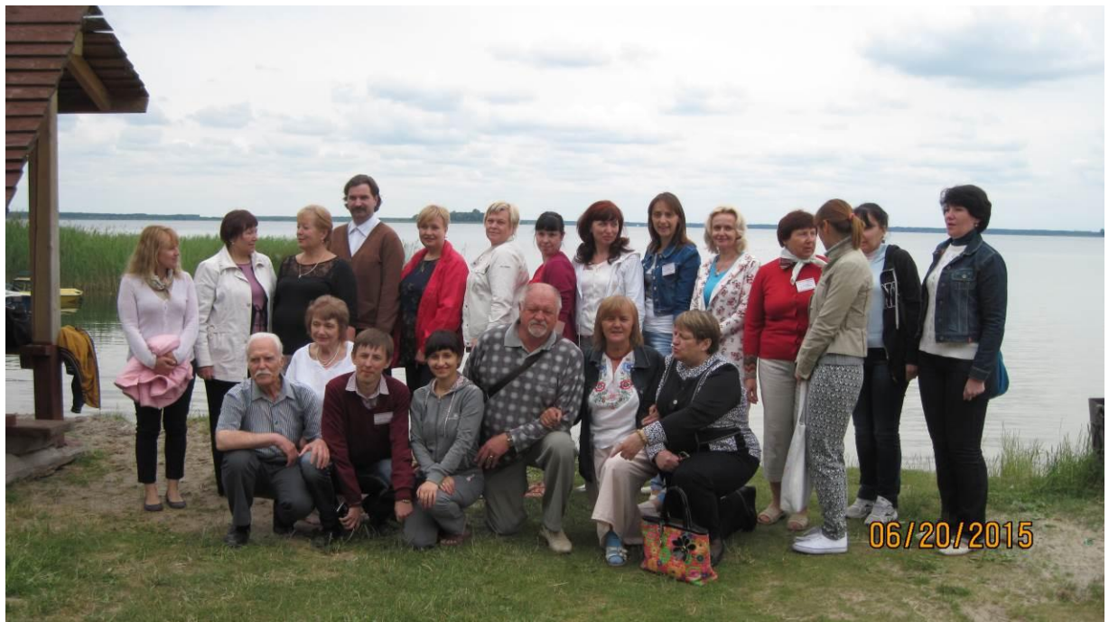
З учасниками конференції з лінгвостилістики на базі «Гарт» (о. Світязь) (червень 2015 р.)