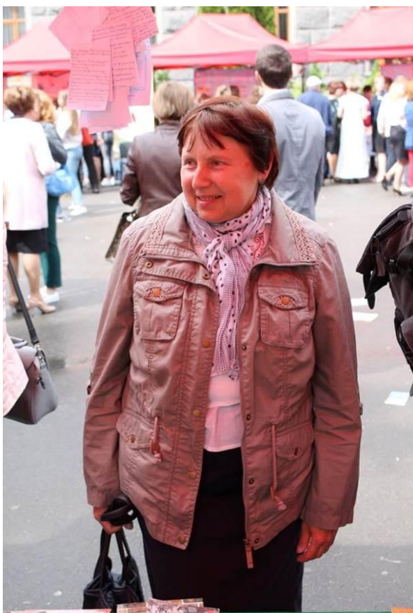
На Яр-фесті СНУ імені Лесі Українки біля головного корпусу (травень 2018 р.)