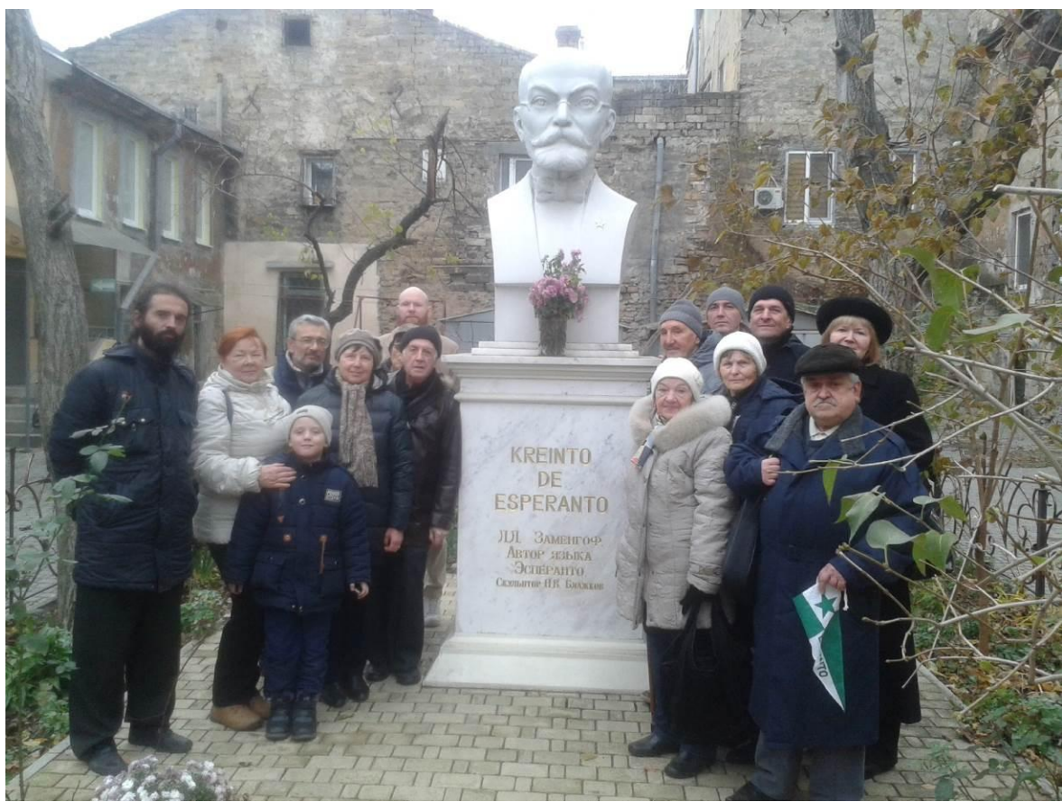
Біля пам'ятника творцю есперанто в м. Одесі (листопад 2017 р.)