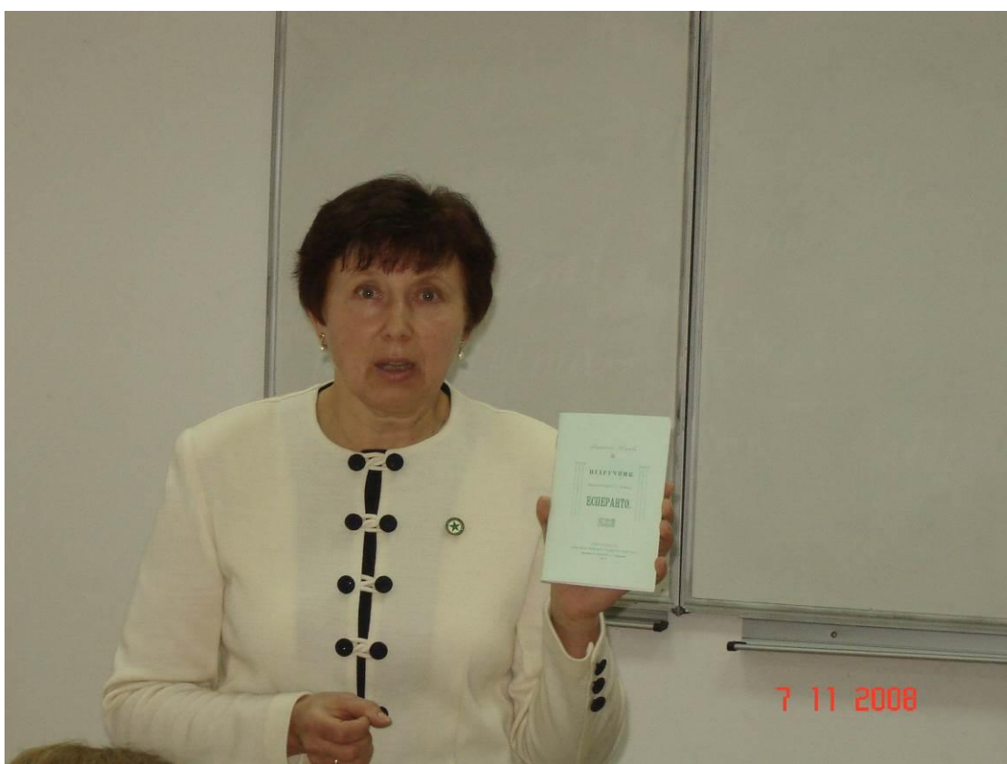
Показ першого українського підручника з есперанто 1907 року на відкритій лекції про міжнародні мови (листопад 2008 р.)