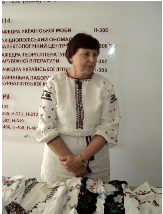
На виставці народного одягу з родинної колекції (листопад 2016 р.)