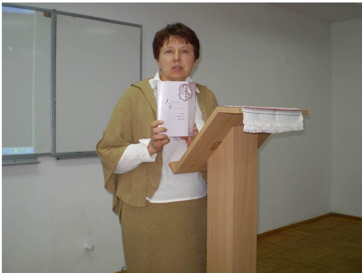
Презентація збірника «Агатангел Кримський – учений, письменник, українець» (Луцьк, листопад 2007 р.)