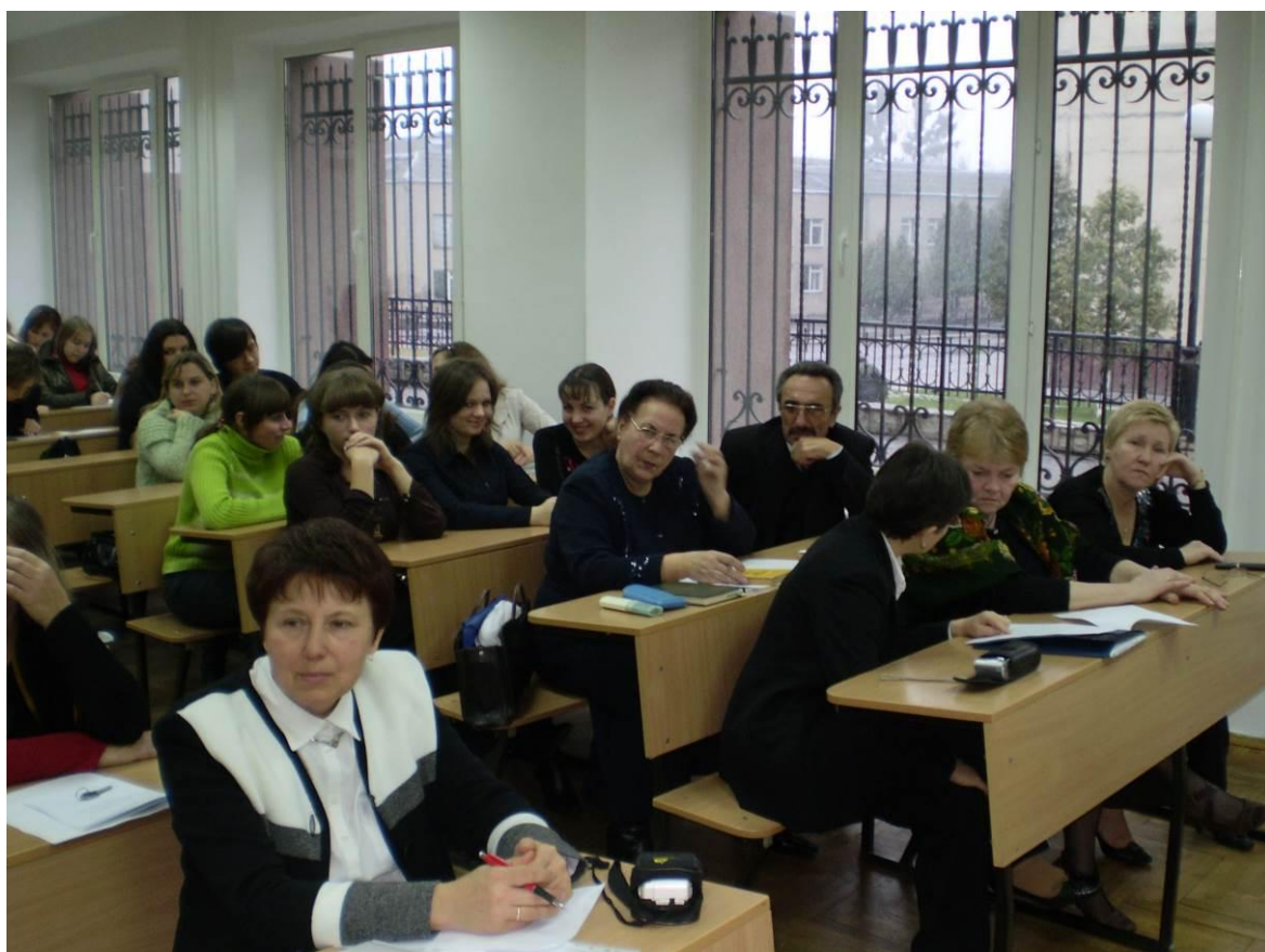
На конференції «Видатні філологи Волині» (листопад, 2007 р.)