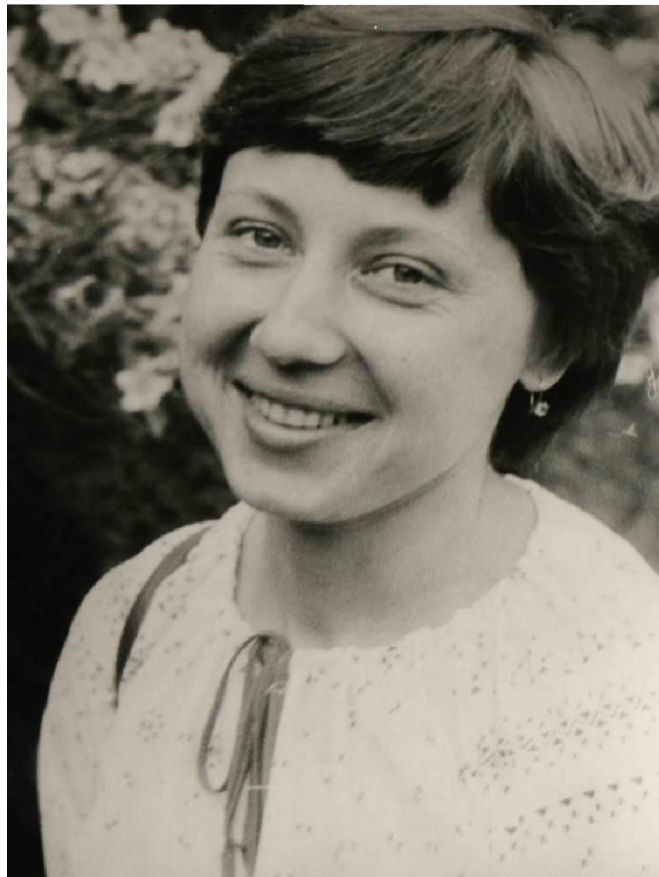
В університетські роки (Київ, травень 1984 р.)