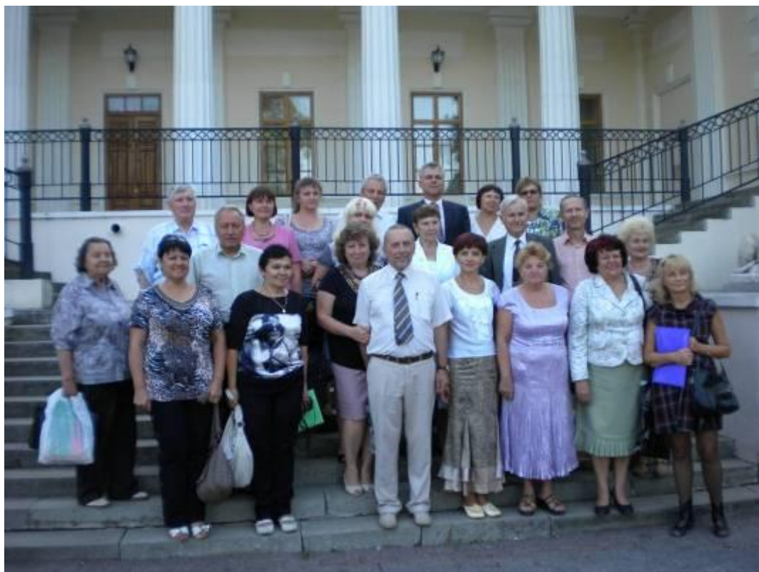
На пленумі координаційної ради Інституту мовознавства НАН України в м. Сімферополі (вересень 2011 р.)