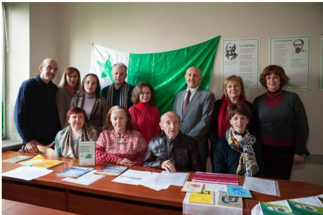
У центрі есперанто СНУ імені Лесі Українки (головний корпус, квітень 2015 р.).