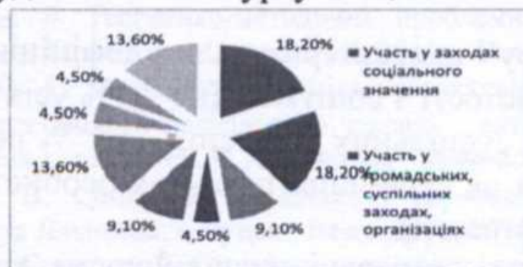
Рис. 1 Трактування дефініції «соціальна активність» студентами 3-го курсу спеціальності «Соціальна педагогіка»

Результати проведеного опитування представлені в діаграмах: рис. 1 (трактування дефініції «соціальна активність» студентами 3-го курсу спеціальності «Соціальна педагогіка»), рис. 2 (трактування дефініції «соціальна активність» студентами 3-го курсу спеціальності «Соціальна педагогіка»), рис. 3 (трактування дефініції «соціальна активність» студентами 4-го курсу спеціальності «Соціальна педагогіка»).