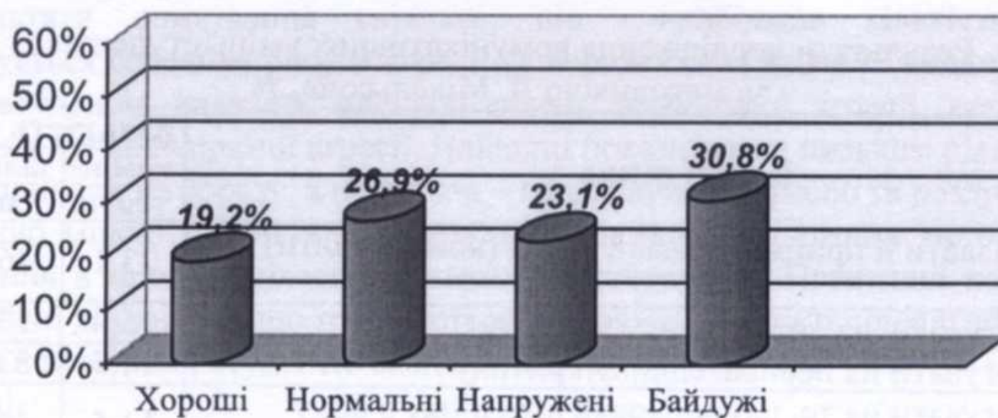
Рис.1. Міжособистісні відносини у студентській групі.

Результати опитування засвідчують про те, що 19,2% студентів характеризували як «хороші», 26,9% студентів – як «нормальні», 23,1% – як «напружені», 30,8% – як «байдужі». На думку 28,5% студентів, такі відносини утруднюються наявністю різних угруповань у межах академічної групи, що призводить до її роз'єднання, внутрішньогрупового протистояння.