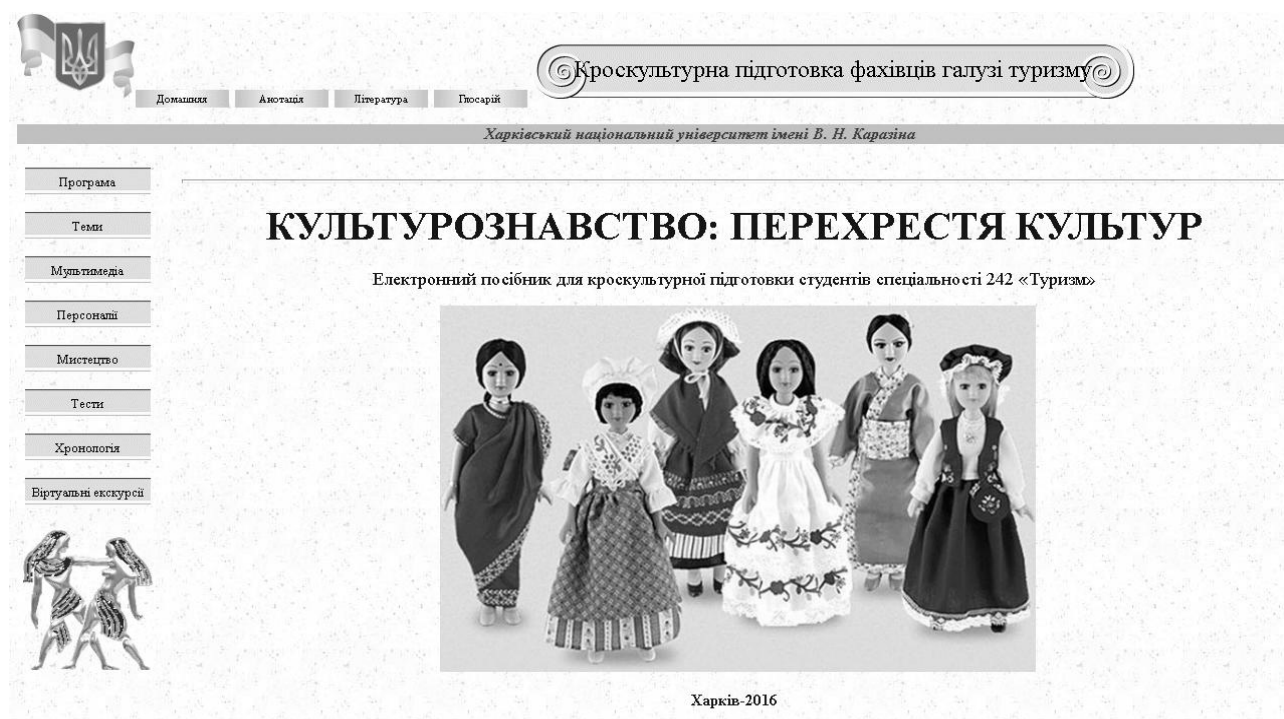
Рис. 2. Головна сторінка електронного посібника

У результаті застосування вище описаної методики студенти створили електронний посібник «Культурознавство: перехрестя культур», головна сторінка якого презентована на рис. 2. Цей посібник є універсальним гіпермедійним засобом інтерактивного навчання студентів і залучення до скарбів світової та національної культури, викладений у компактній формі гіпертекстового середовища і призначений для використання у процесі кроскультурної підготовки майбутніх фахівців галузі туризму.