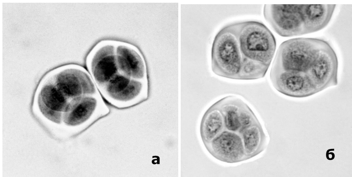
Рис. 2. Стадія спорад у рослин: а – гетерозигот Dsm4/dsm4 , б – гомозигот dsm4/dsm4

Порушення у другому поділі мейозу зумовлені великою чисельністю порушень, які відбуваються під час першого мейотичного поділу. В метафазі II деякі хромосоми лежали поза межами екваторіальних пластинок. Анафаза II, як і анафаза I, проходила з порушеннями типу забігання і відставання хромосом і сестринських хроматид. На стадії спорад (рис. 2 а) спостерігали нерівні тетради, тетради, тріади і діади з мікроядрами (рис. 2 б), що призводить в подальшому до значної стерильності пилку.