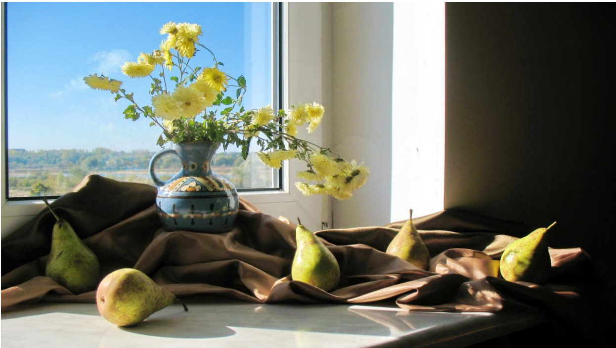
Запропонована постановка натюрморту