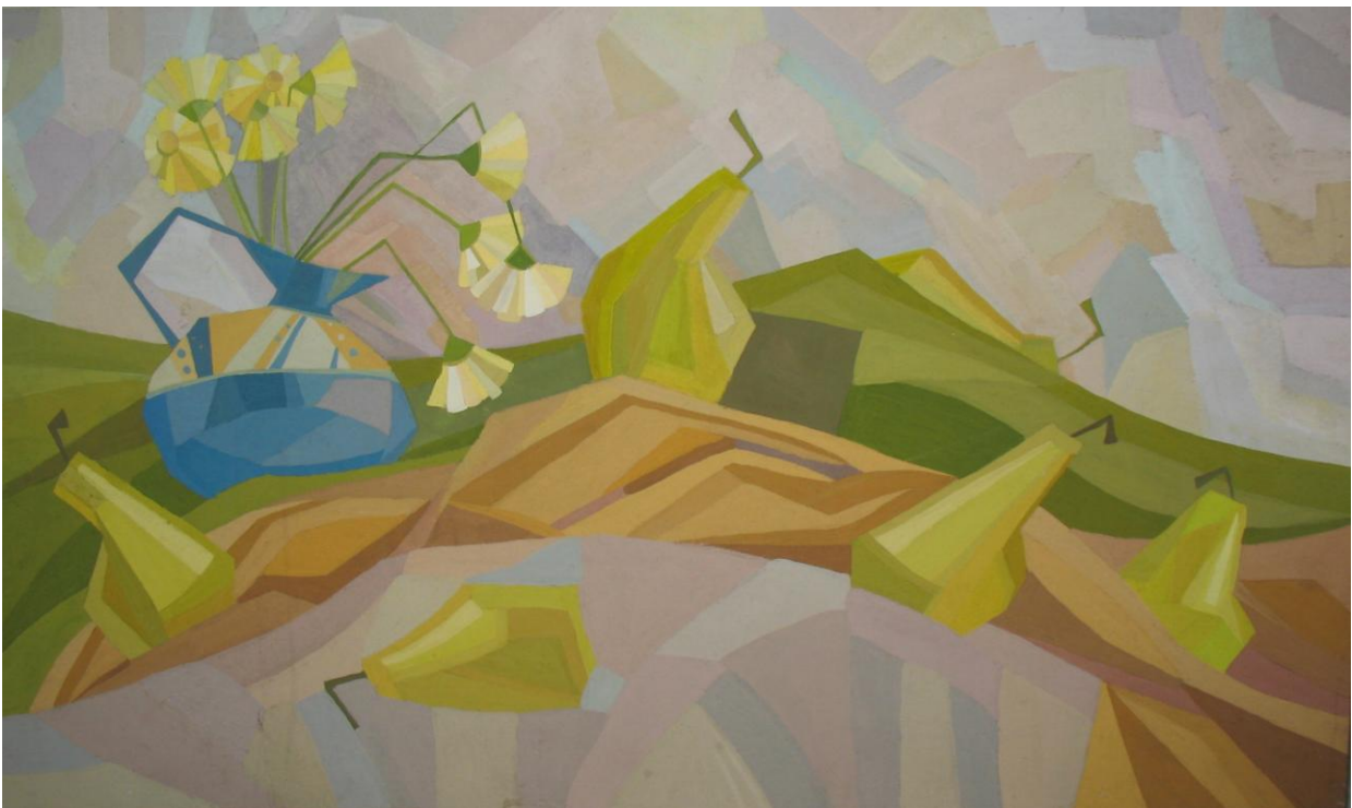
«Натюрморт з грушами» Виконала ст. Чубай Ю.