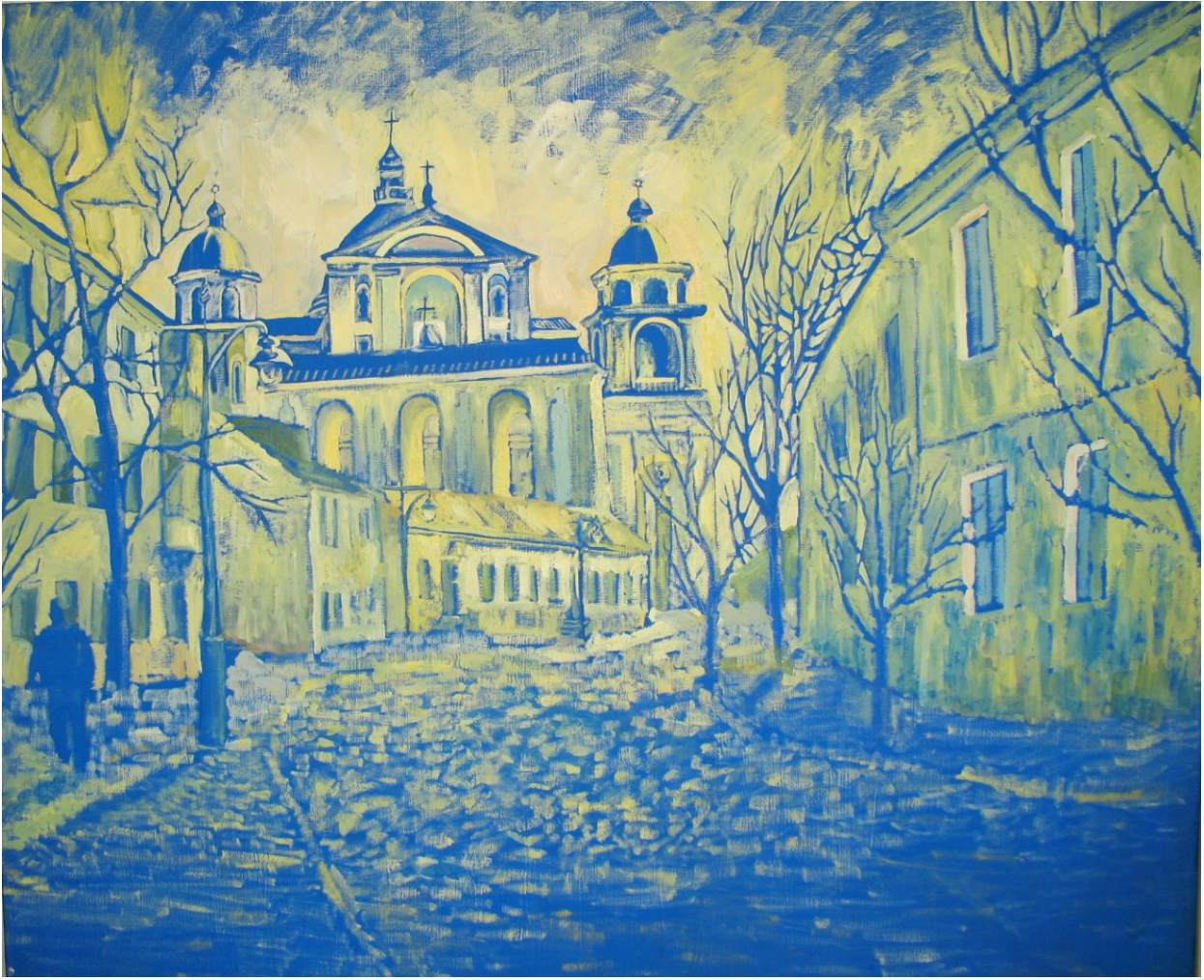
« Мое місто» Виконала ст. Барабощко К.