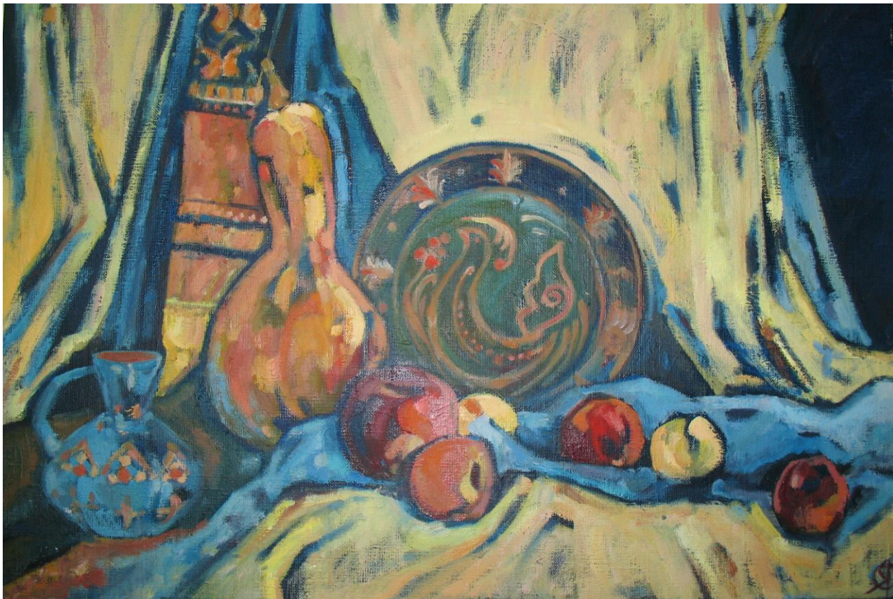
«Український натюрморт» Виконала ст. Якимчук О.