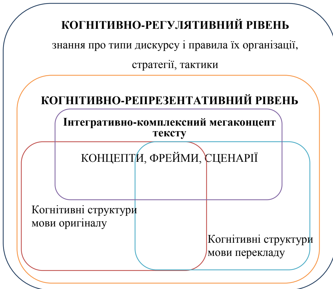
Рис. 1.2. Когнітивна структура перекладацького дискурсу

Крім власне когнітивних структур, які взаємодіють в перекладі, когнітивно-дискурсивний підхід зумовлює інтерес до когнітивної організації перекладацького дискурсу як такого. Розуміючи дискурс як процес, організований на когнітивному рівні, розрізняємо два рівні когнітивної організації дискурсу: когнітивно-регулятивний (когнітивні структури, які забезпечують здійснення комунікації: знання про типи дискурсу і правила поведінки, стратегії, тактики тощо) і когнітивно-репрезентативний (когнітивні структури, які узагальнюють досвід концептуалізації світу і необхідні для інтерпретації ситуацій, представлених в дискурсі: концепти, фрейми, сценарії, як показано на рис. 1.2.