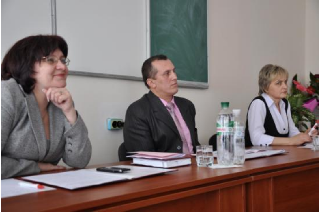
Під час роботи спеціалізованої вченої ради (квітень, 2011)