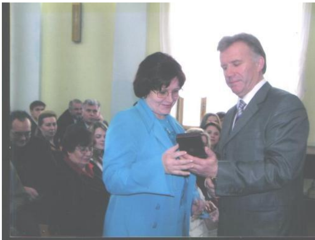
Нагородження Міністром освіти і науки України Станіславом Ніколаєнко нагрудним знаком «За наукові досягнення» (вересень, 2006)