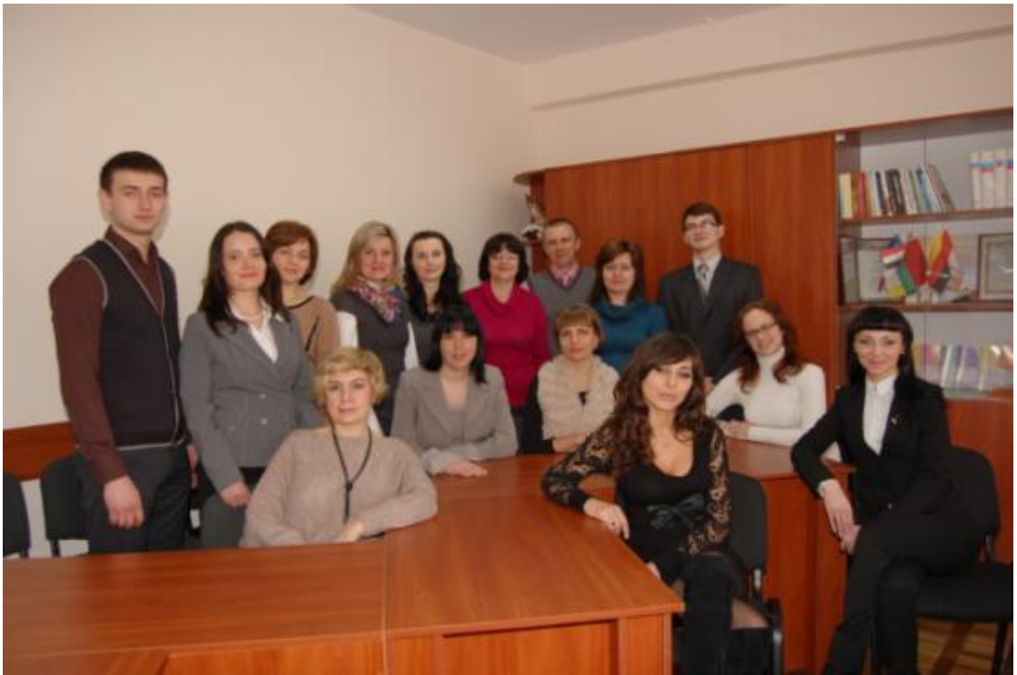
У колі молодих дослідників наукової школи професора Жанни Вірної (лютий, 2012)