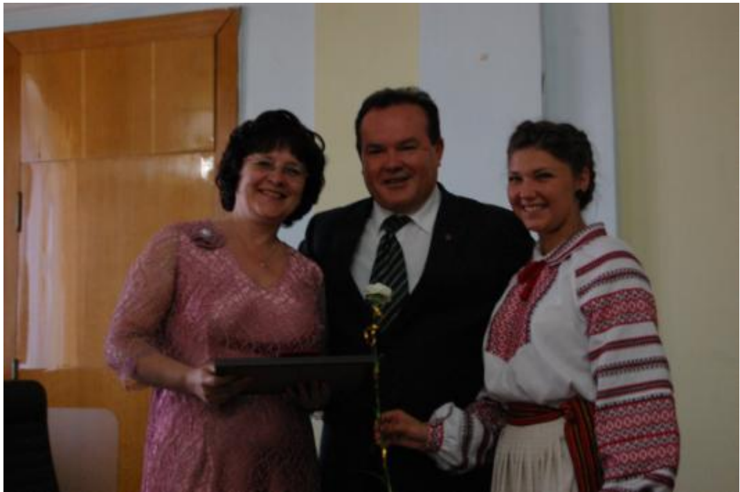
Нагородження золотим нагрудним знаком Волинського національного університету імені Лесі Українки (травень, 2012)