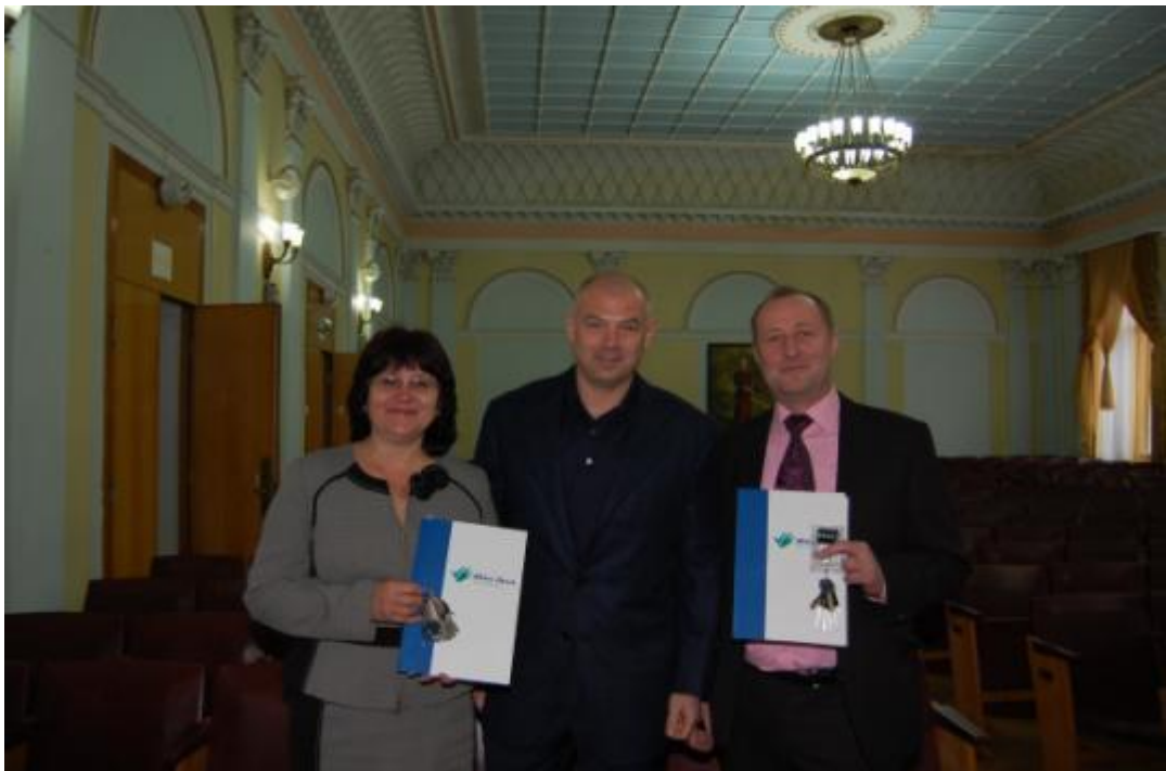
Відзнака цінним подарунком від фонду Ігоря Палиці «Новий Луцьк» за успіхи у підготовці талановитої молоді (січень, 2013)