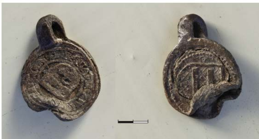
Рис. 1. Торгова пломба з гербом м. Цвіккау XVI ст.

Об'єкт 2. Споруду виявлено у центральній частині розкопу на глибині 0,5 м від денної поверхні. У ході робіт досліджено частину споруди підпрямокутної форми, орієнтовану кутами за сторонами світу, розміром 4,3 × 4,0 м, у межах розкопу заглиблену в материк на 1,2 м. Стінки похилі, долівка рівна, добре трамбована. Заповнення споруди складав гумусований суглинок, перемішаний з вугликами та дрібними фрагментами глиняної обмазки, остеологічні залишки, фрагменти кружальної кераміки. За аналогіями кераміка датується кінцем XVI—XVII ст. Знайдено також фрагменти сюжетних і так зв. «коврових» кахель із зеленою поливою та без неї, за аналогіями датуються кінцем XVI—XVII ст. Металеві вироби представлені численними знахідками цвяхів, голок, куль і фрагментів бронзових