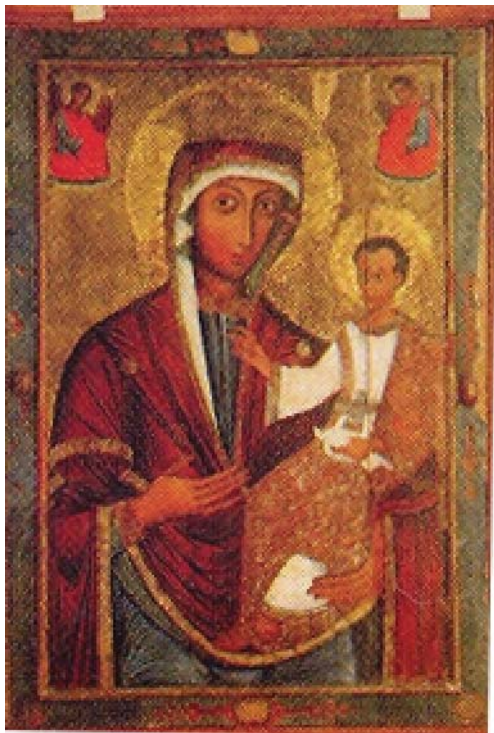
Рис. 3. Богородиця Одигітрія.