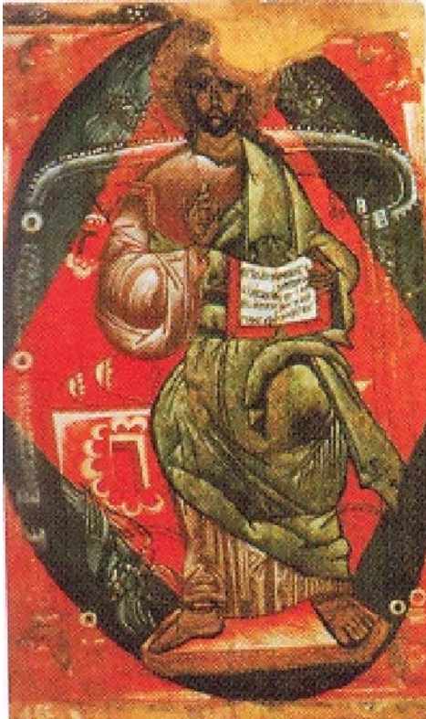
Рис.1. Спас у славі.