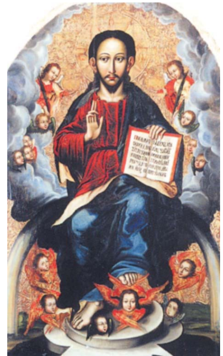
Рис. 4. Спас.

ікони «Спас» (рис. 4) і «Іоаким і Анна» (рис.5) першої половини XVII ст.