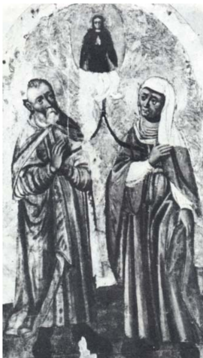
Рис. 5. Іоаким і Анна.

споруд. Бригади малярів комплексно виконували роботи під керівництвом старшого майстра, який добре володів малярськими справами. Після закінчення робіт по оздобленню храму його ім'я виکارбовувалось, або вирізалось на одній із стін, або ікон храму.