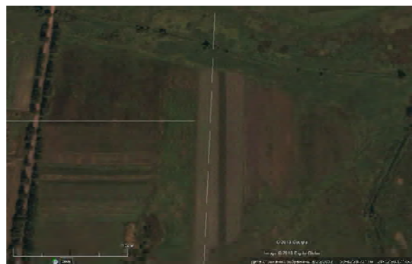
Рис.3. Пам'ятка на фото Гугл.