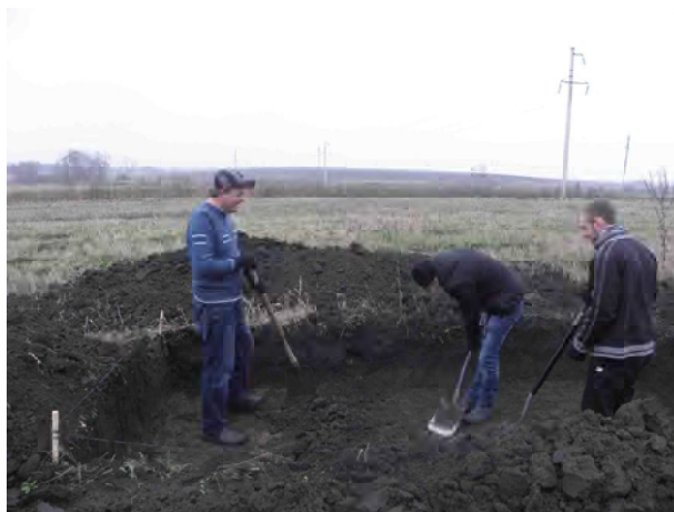
Фото 4. Початок робіт. Зняття верхнього шару.