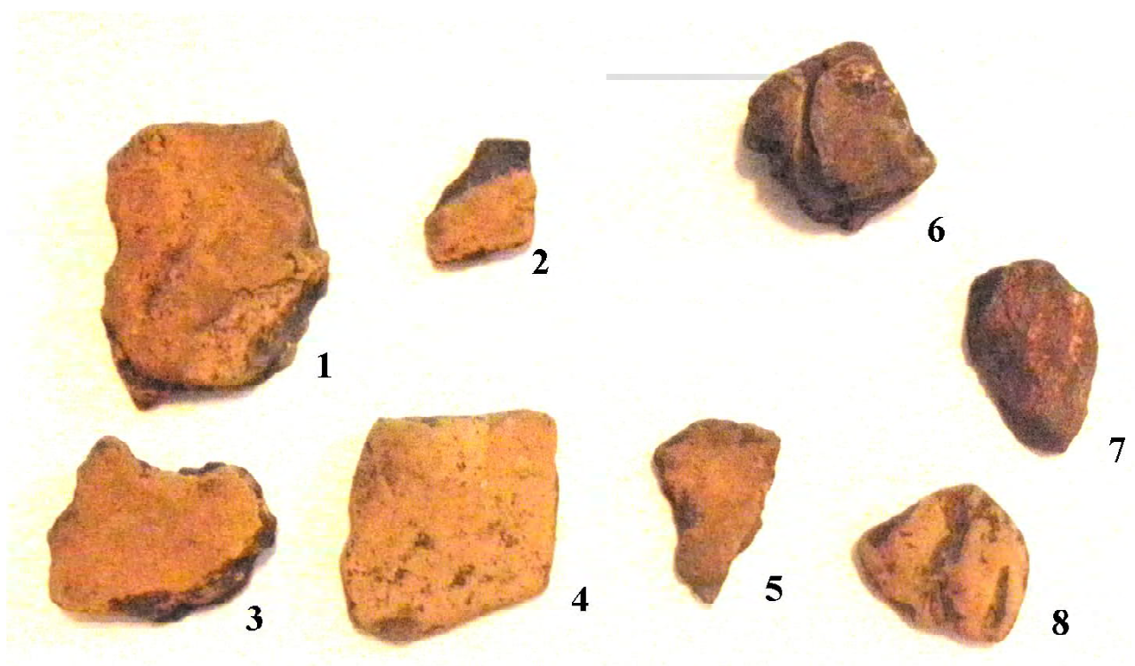
Фото 1. Липна кераміка та глиняна обмазка з розкопу.