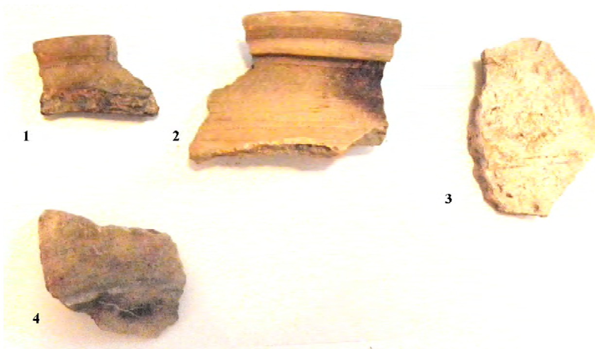
Фото 2. Кружальна кераміка з розкопу.