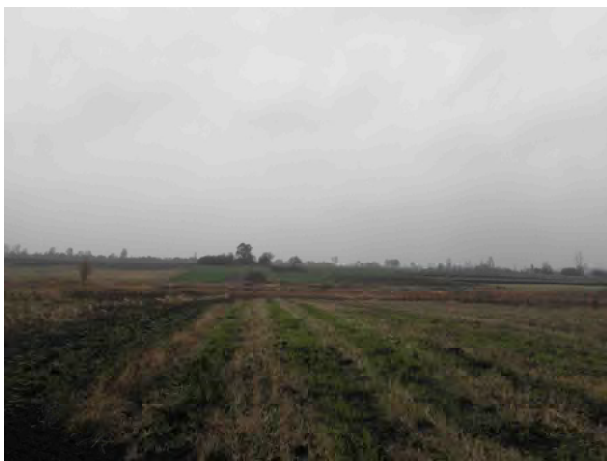
Фото 3. Панорама пам'ятки з півдня.