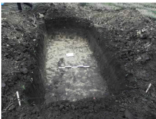
Фото 5. Завершення робіт. Зачистка розкопу на рівні материка (0,95 м).