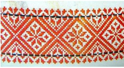
а) квітка і ромб