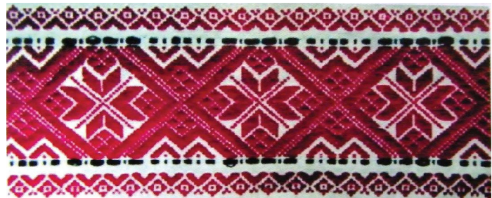
б) повтор ромбів з квітками