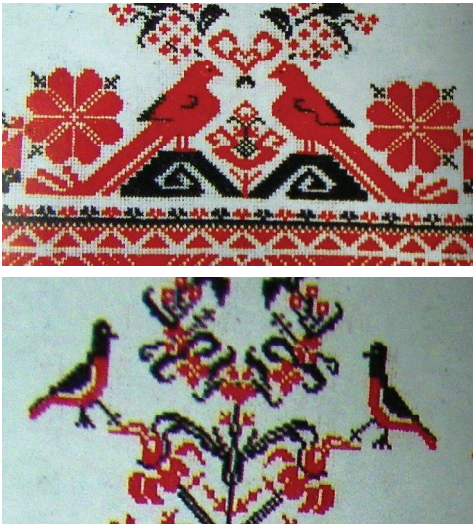
Мал. 1. Орнамент із застосуванням символу птаха