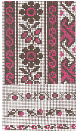
в) символ Сонця і Води