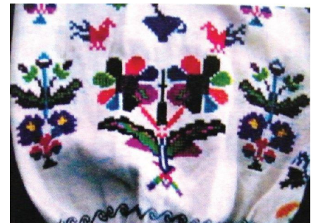
а) птахи у парі і злиття двох квіток