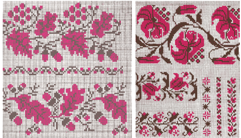
а) дубове листя і калина