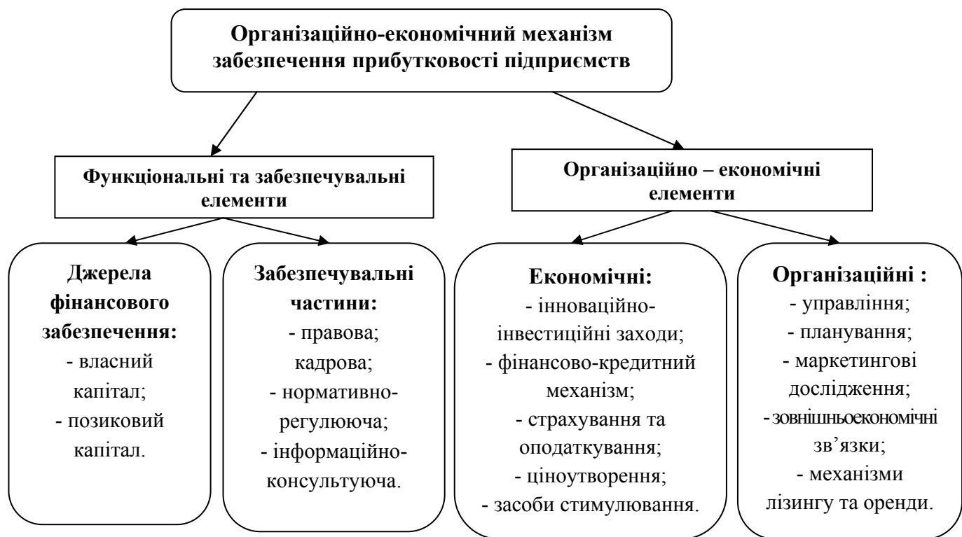
Рис.3. Схема формування організаційно-економічного механізму забезпечення прибутковості підприємств*