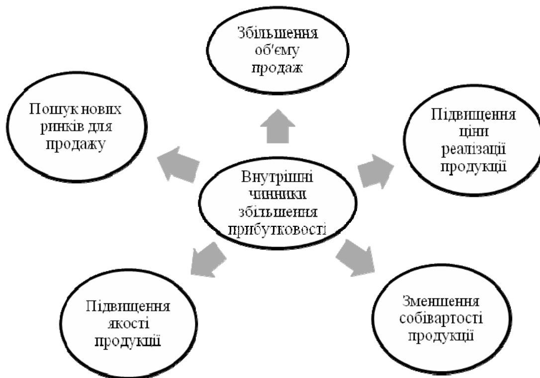
Рис. 2. Внутрішні фактори щодо забезпечення зростання прибутковості підприємства*