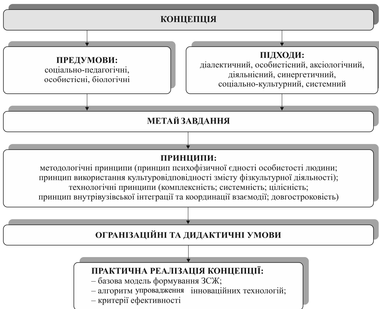
Рис. 1. Концепція формування ЗСЖ студентів у процесі фізичного виховання з використанням інноваційних технологій [8]

Вивчення педагогічних основ створення умов для забезпечення фізичного, психічного й соціального благополуччя студентів дали змогу С. М. Футорному [8] подати основні положення концепції формування ЗСЖ студентів у процесі їх фізичного виховання з використанням інноваційних технологій (рис. 1).