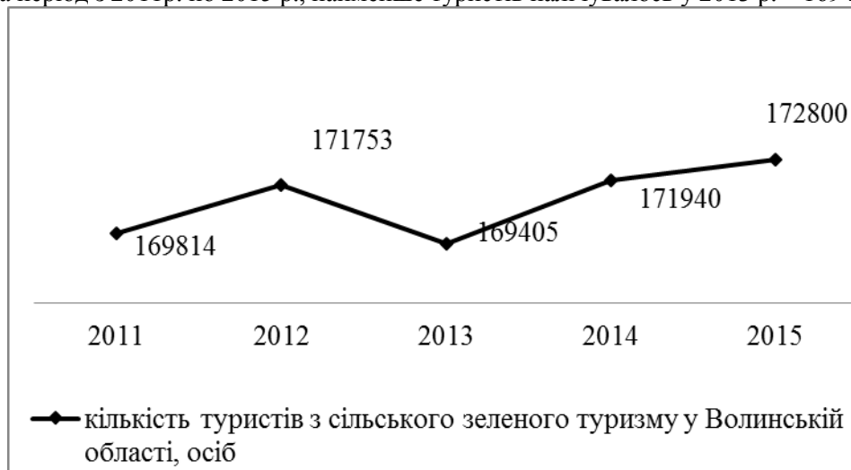
Рисунок 1. Динаміка чисельності туристів сільського зеленого туризму у Волинській області (2011-2015 рр.) [10]

У 2015 р. на території Волинської області налічувалось 172800 туриста, які надали перевагу сільському туризму. За період з 2011р. по 2015 р., найменше туристів налічувалось у 2013 р. – 169405 (рис. 1).