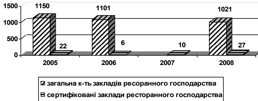
Рис. 2. Результати сертифікації послуг харчування у Волинській області.

До вагомих стримуючих факторів щодо отримання сертифікату відповідності є застаріла матеріальна база закладів ресторанного господарства, яка не відповідає сучасним вимогам стандартів та попиту споживачів для задоволення їх потреб, відсутність впливу з боку органів влади і звісно саме бажання власників закладів ресторанного господарства, так як примусити провести сертифікацію орган сам невзможі.