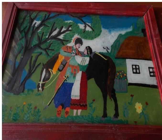
Сорока Т.М. «Ромео і Джульєта» скло, олія