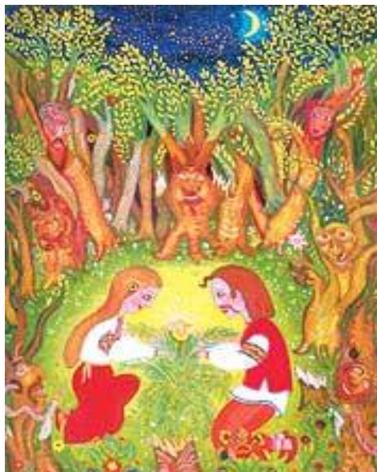
І. Сколоздра «Цвіт папороті» скло, олія

Народне малярство на склі характеризують, як наївне, примітивне мистецтво. Твори вважалися низько вартісними, адже їхню цінність визначали винятково у порівнянні з професійним живописом, який, як відомо, має свої закони й іншу природу буття. Але саме в цій простоті, лаконічності композиційного та колористичного вирішення криється глибинна суть української душі, ментальності нації.