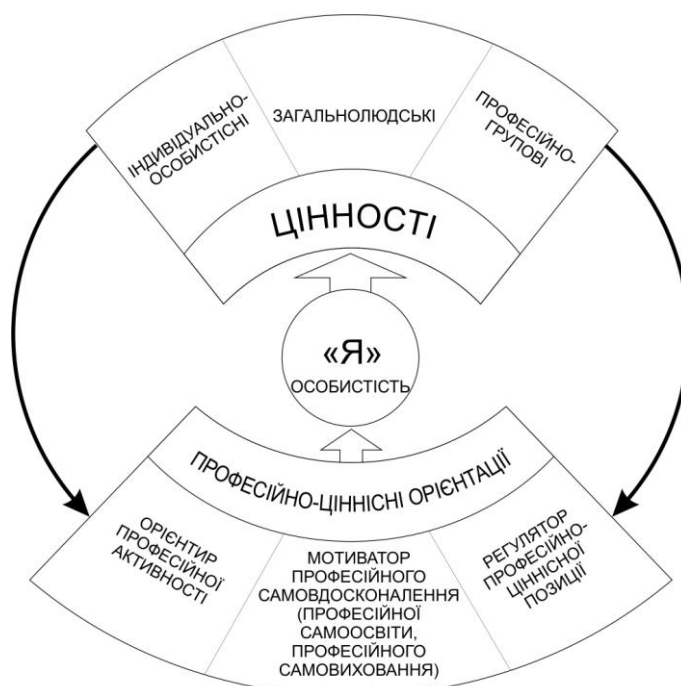
Рис. 2. Трансформація цінностей у професійно-ціннісні орієнтації особистості

Вагомою ознакою ціннісної орієнтації, в тому числі й професійної, є оцінний елемент, пов'язаний із рівнем знання (повсякденним або науково-теоретичним) про оцінюваний об'єкт або явище і містить у собі оцінки майбутнього (цінність-мета), сьогодення (співвідношення цінності-мети з інструментальними цінностями) і минулого (ставлення до різних цінностей-цілей та інструментальних цінностей, що функціонували в культурі минулого).