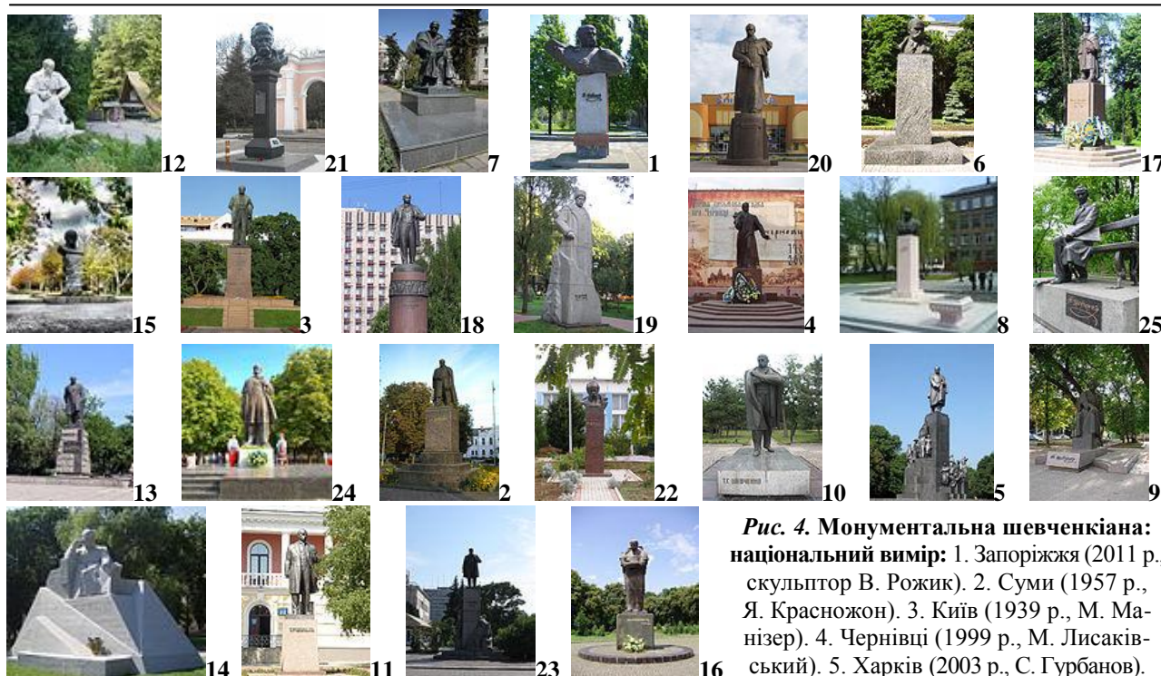
Рис. 4. Монументальна шевченкіана: національний вимір: 1. Запоріжжя (2011 р., скульптор В. Рожик). 2. Суми (1957 р., Я. Красножон). 3. Київ (1939 р., М. Манізер). 4. Чернівці (1999 р., М. Лисаківський). 5. Харків (2003 р., С. Гурбанов).

6. Житомир (1961 р., М. Воронський). 7. Тернопіль (1982 р., М. Невеселий). 8. Вінниця (2008 р., м. Крижанівський). 9. Дніпропетровськ (1954 р., О. Васякін). 10. Миколаїв (1958 р., І. Діба). 11. Кіровоград (1982 р., М. Воронський та А. Гончар). 12. Львів (1992 р., В. та А. Сухорські). 13. Одеса (1966 р., А. Ю. Білостоцький). 14. Полтава (1954 р., О. Васякін). 15. Херсон (1971 р., І. Білокур). 16. Ужгород (1999 р., М. Михайлюк). 17. Івано-Франківськ (2011 р., Лео Мол). 18. Донецьк (1955 р., М. Воронський та А. Олійник). 19. Хмельницький (1992 р., І. Зноба та В. Зноба). 20. Ялта (2007 р., Лео Мол). 21. Сімферополь (1997 р., Василь і Володимир Одрехівські). 22. Севастополь (2003 р., О. Шмаков). 23. Черкаси (1981 р., О. П. Скобликова). 24. Луганськ (1998 р., І. М. Чумак). 25. Чернігів (1992 р., В. Чепелик)