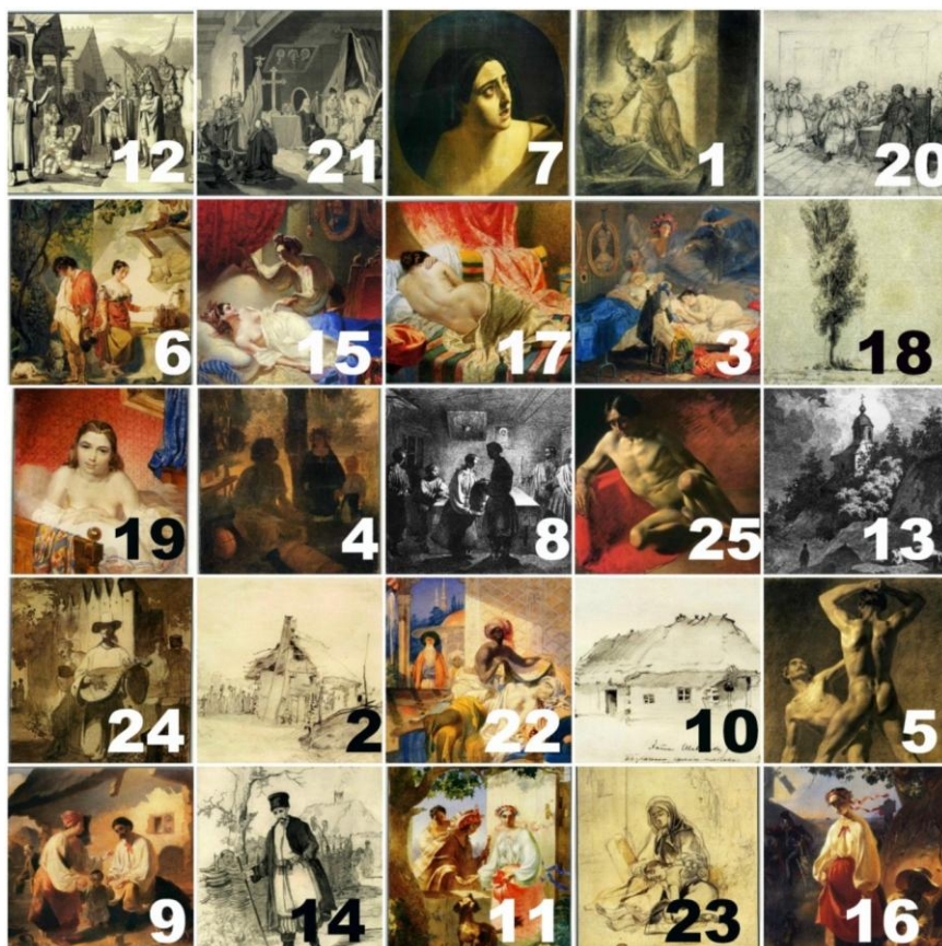
Рис. 5. Картини, малюнки, гравюри з експозицій Національного музею Тараса Шевченка (Київ):

Праці шевченкознавців здебільшого пов'язані з дослідженням життя та творчості славетного Кобзаря, проте існує обмежене коло публікацій, присвячених вивченню шевченківських культурно-інформаційних систем (музейні комплекси, музеї, будинки-музеї, історико-культурні заповідники). Найбільша кількість оригінальних музейних предметів сконцентрована в Києві, у Національному музеї Тарасові Шевченка (близько 73 тис. експонатів). Нижче наведено таблицю Шульте, адаптовану до малюнків, гравюр і картин Тараса Шевченка (рис. 5).