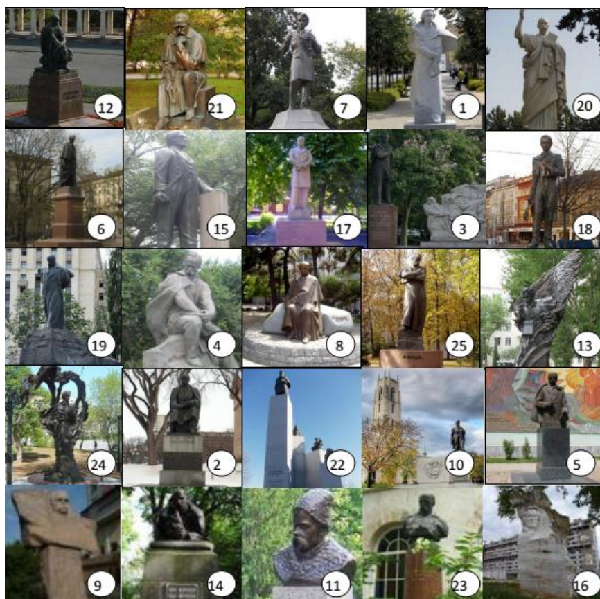
Рис. 3. Монументальна шевченкіана: світовий вимір: 1. Вільнюс (Литва). 2. Вінніпег (Канада). 3. Буенос-Айрес (Аргентина). 4. Актау (Казахстан). 5. Ташкент (Узбекистан). 6. Санкт-Петербург (Росія). 7. Варшава (Польща). 8. Тбілісі (Грузія). 9. Алмати (Казахстан). 10. Вашингтон (США). 11. Копенгаген (Данія). 12. Орськ (Росія). 13. Баку (Азербайджан). 14. Клівленд (США). 15. Курітіба (Бразилія). 16. Тулуза (Франція). 17. Тирасполь (Молдова). 18. Прага (Чехія). 19. Москва (Росія). 20. Рим (Італія). 21. Будапешт (Угорщина). 22. Оттава (Канада). 23. Париж (Франція). 24. Софія (Болгарія). 25. Мінськ (Білорусь)