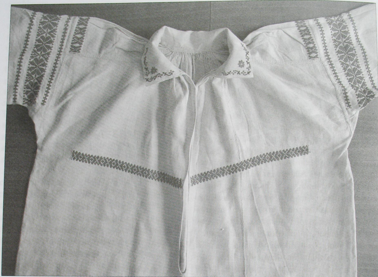
Фрагмент жіночої сорочки. Верхня частина рукавів, уставки, пазуха оздоблені вишивкою в техніці "занизування", комірець гладдю. Нитки заполоч. Льон, домоткане полотно. 1930-ті рр. Село Кухче Зарічнянського р-ну Рівненської обл. (ПВ).

До середини ХХ ст. майже в кожній поліській селянській хаті стояв саморобний ткацький верстат та інше необхідне знаряддя. Полотно ткали з конопель, льону. Часто полотно виготовляли, поєднуючи льон наполовину з коноплями, пізніше почали використовувати для ткання куповані бавовняні нитки [15]. Крім простого полотняного переплетення «у прощину» побутовали техніки багато-ремізного, а також перебірного ткацтва, за допомогою яких створювались складні орнаментовані тканини. Були поширені такі назви технік ткацтва, як «перебір пальцями», «під дошку», «на підніжки», «в поворотку», «в кружкі».