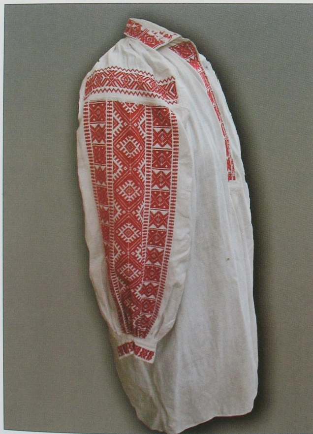
Жіноча сорочка оздоблена вишитим геометричним орнаментом в техніці «занизування». Село Острівок Камінь-Каширського р-ну. (ВКМ)