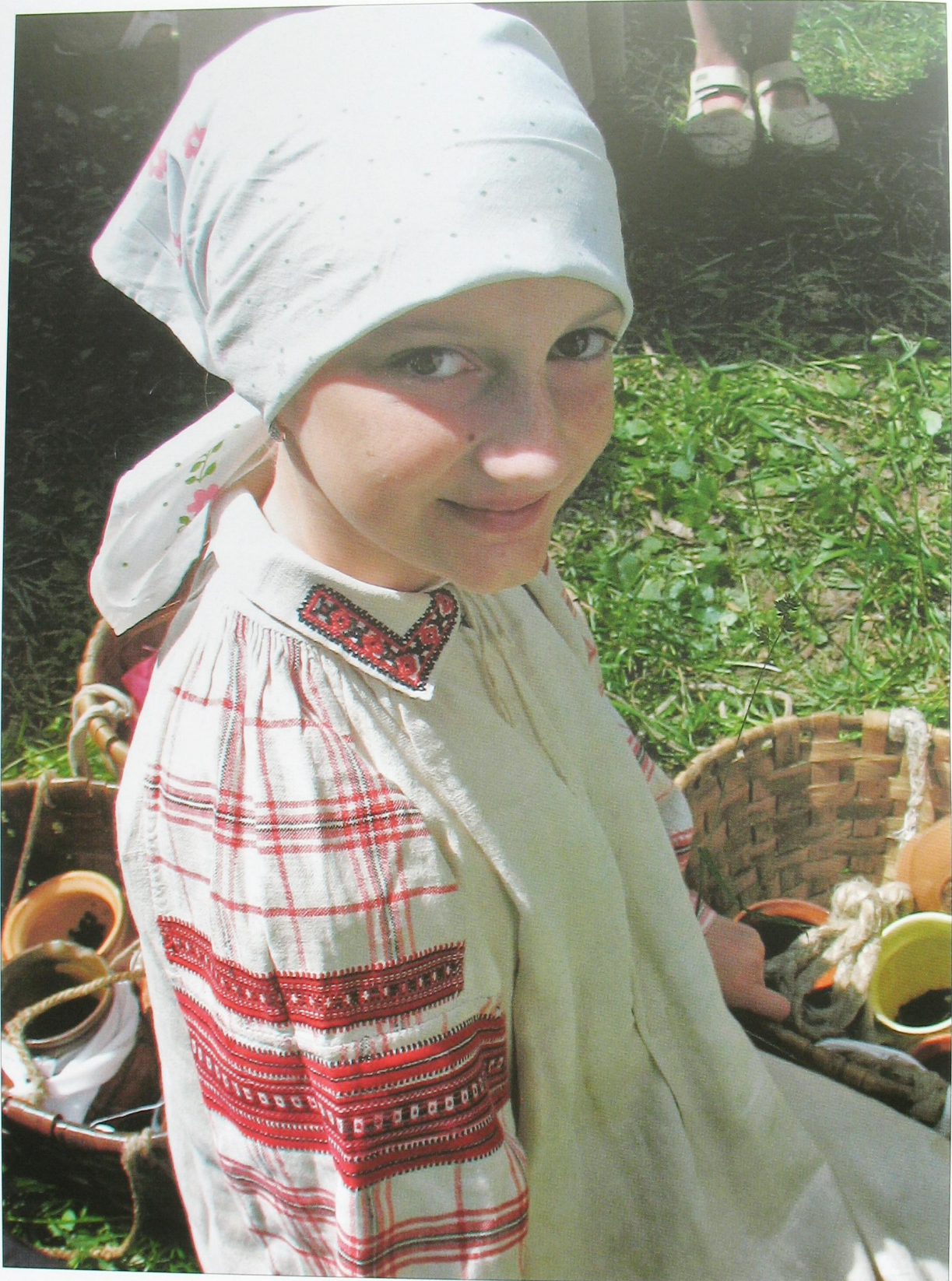
Жіноча сорочка оздоблена тканим орнаментом та вишивкою хрестиком. Маневицький р-н Волинської обл..