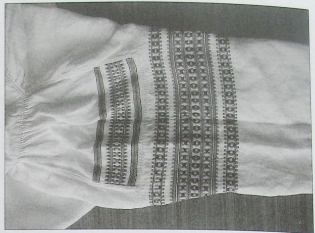
Фрагмент жіночої сорочки. Верхня частина рукава та уставки оздоблена смугастим тканним орнаментом. Нитки заполич. Льон, домоткане полотно. 1930-ті рр. Село Нуйно Камінь-Каширського р-ну Волинської обл. Із колекції народного одягу шкільного музею с. Нуйно.

Вже починаючи з народження людини сорочка ставала для неї певним атрибутом священної. Часто новонароджену дитину для того, щоб була здоровою, обгортали в материну чи батькову сорочку [6]. Ця сорочка обов'язково мала бути вже ношеною «пробованою», щоб не завдати дитині якоїсь шкоди. В деяких селах Волинського Полісся під час хрещення під полотняну пеленку – «плащик», «крижму» підставляли хлопчику чоловічу сорочку, а дівчинці жіночу. В селі Рудка Любешівського р-ну Волинської обл. ще до 50-х років ХХ ст. побутував звичай подушку, на яку клали дитину, що везли в церкву для хрещення, «одягати» в сорочку [23]. Часто на Поліссі дитину одягали в першу сорочку, яку вже носили хтось із старших братів чи сестер «щоб діти любилися» [5]. В деяких районах існував звичай, перед тим як одягти на дитину першу сорочку, потримати в ній щось металічне, наприклад ніж, щоб дитина виросла, «міцною як залізо» [19]. Прати та сушити сорочку дитини до року потрібно було не вивертаючи. Випрану сорочку не можна було лишати сушитись на ніч чи вшати під деревами «щоб лякі не напали», «щоб спокійно спало в ночі» [23]. Також поліщуки вірили, що чисту сорочечку дитині потрібно одягати в суботу, тоді вона швидше ростиме. Інколи ведучи дитину «на люди» сорочку дитині одягали на виворіт, «щоб не наврочили». Старі