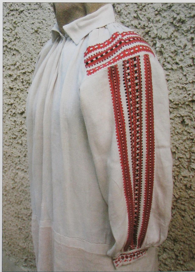
Жіноча сорочка оздоблена смугастим тканим орнаментом. Камінь-Каширський р-н. (ВКМ)