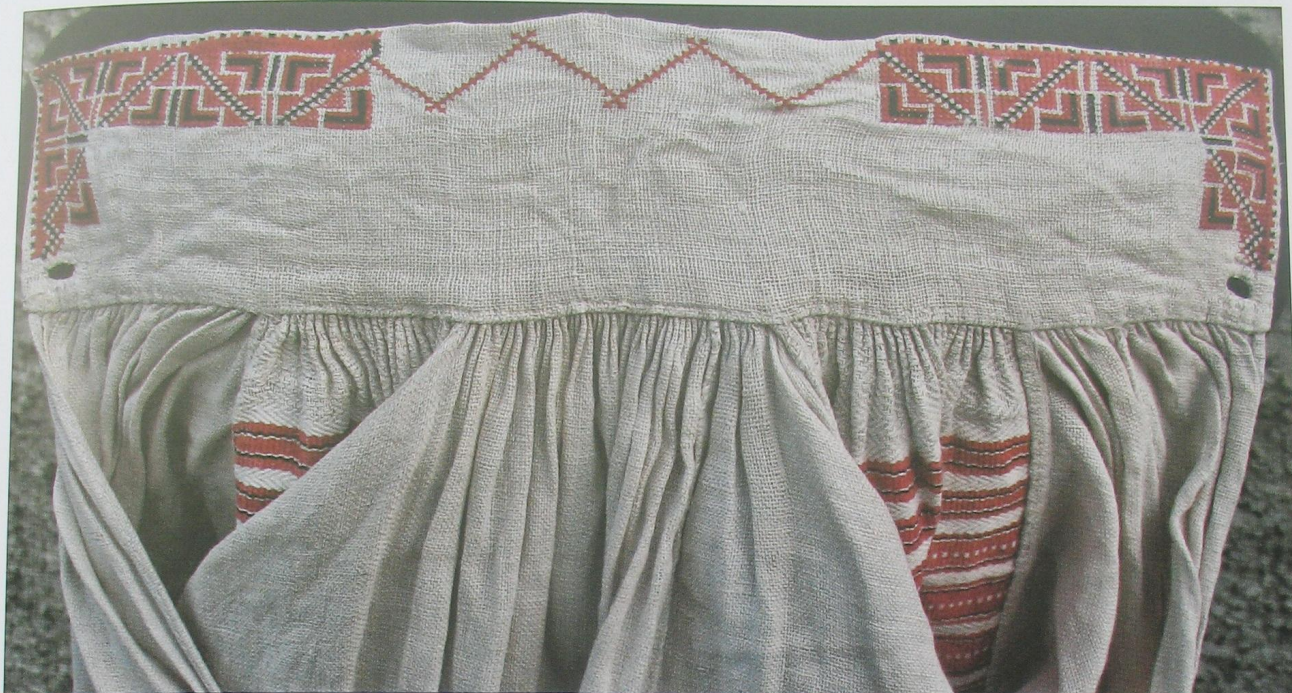
Комірець жіночої сорочки оздоблений геометричним орнаментом вишивкою в техніці хрестика. Село Велика Річниця Камінь-Каширського р-ну. Волинської обл. (ВКМ)