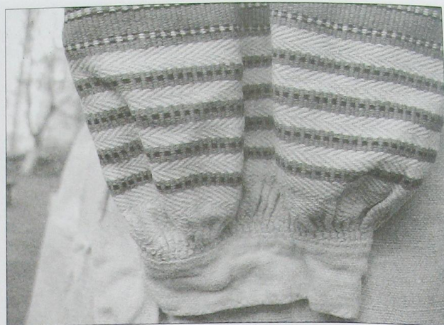
Фрагмент жіночої сорочки. Низ рукава завершений "чохликом". Льон, домоткане полотно. Поч. ХХ ст. Село Велика Річниця Камінь-Каширського р-ну. (ВКМ) Д-926.

У Любомльському, Шацькому районі Волинської області та Сарненському і Рокитнівському районі Рівненської області візерунок частіше вкриває уставку біля стику з рукавом у вигляді поперечних орнаментальних смуги, а зовнішній бік рукава – поздовжніх. Однак найбільшого поширення на Поліссі набула така схема розміщення декору сорочок, в якій