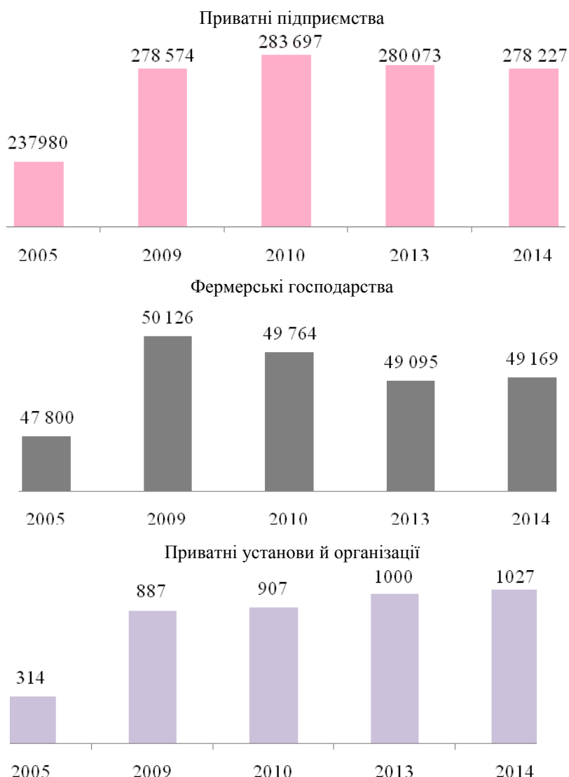
Рис. 1. Динаміка кількості приватних суб'єктів господарювання в Україні, станом на 1 січня щороку

підприємства. У ньому з'явилося лише сім нових приватних компаній. Ця модель розвитку суттєво відрізняється від моделей, прийнятих у десяти нових членах ЄС, де відбулися значні зміни у структурі економіки завдяки появі нових приватних компаній і залученню прямих фінансових інвестицій, спрямованих на реалізацію проектів з нуля [5, с. 28].