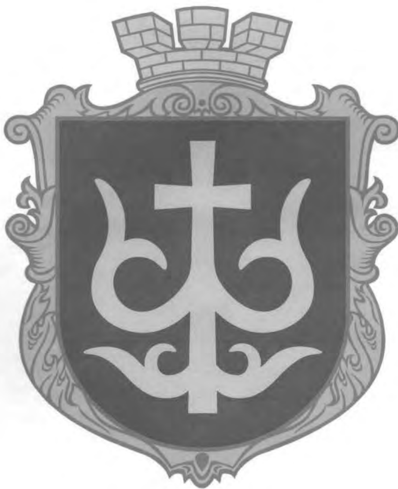
Рис. 2. Герб Шацька, створений на основі князівський печаток, знайдених на розкопі