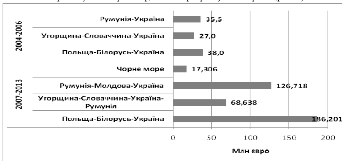
Рис. № 2. Обсяги фінансування програм транскордонного співробітництва за участю України*

Із запровадженням Європейського інструменту сусідства та партнерства (далі – ЄІСП) стратегічно та політично обумовлений характер допомоги з боку ЄС був посилений збільшенням обсягів фінансування транскордонних програм у кілька разів (рис. 2).